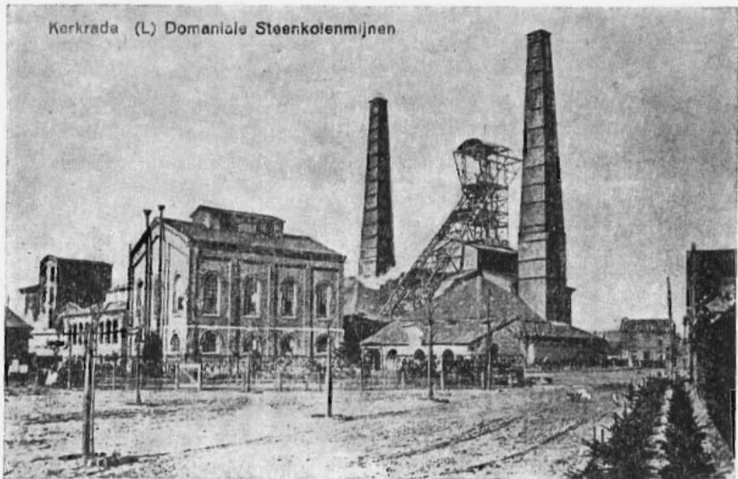
Afbeelding als prentbriefkaart van het fabriekscomplex van de Domaniale mijn omstreeks 1915.

weest als landmeester 1e klas bij het Departement de la Roer, was in 1825 aangesteld als „conducteur” bij de Domaniale mijn. 2 Hij had voordien enige praktijk opgedaan bij mijnontginningen in Pruisen. Tijdens de Belgische tijd bleef hij als conducteur op de Domaniale mijn werkzaam.