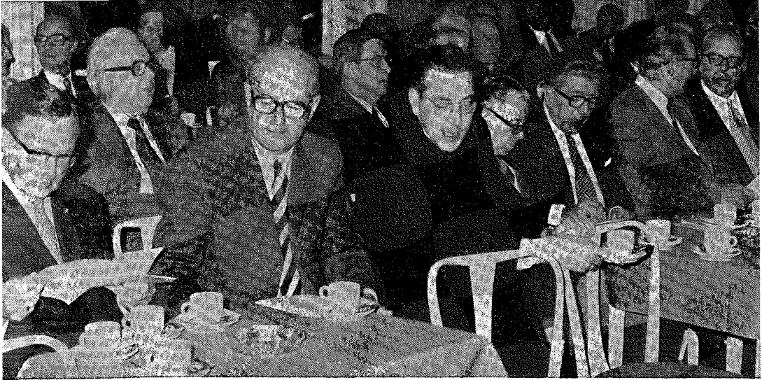
Een ongedwongen moment tijdens de jubileumvergadering op 4 oktober 1974.