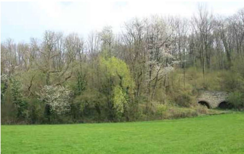
Afb. 2: Het landschap van de Putberg ten westen van Heerlen [Met dank aan het Natuurhistorisch Genootschap in Limburg. Foto: Olaf Op den Kamp]

vakantie: 'over een uur zal er geen toerist uit het vlakke Holland meer luisteren naar de klokkende beekjes, geen mensch zal er letten op de mooie bloemen van dal en bosch en berg (...); dan is het land weer alleen voor de bewoners, die eerst langzamerhand gaan beseffen wat de menschen uit Holland hier komen zoeken. Zij kunnen niet weten dat zij in een streek wonen, zoo mooi en zoo belangwekkend voor natuurvrienden, als er geen tweede is in ons land'. 8 De kloof tussen de natuuronderzoekers uit 'Holland' en de lokale bevolking in Limburg komt hier duidelijk tot uitdrukking.