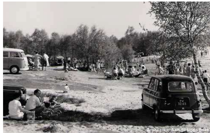
Afb. 12: De Brunsummerheide als recreatiegebied in de jaren vijftig

was dat absoluut waardevol als natuurbeschermingseducatie, maar het doet sterk denken aan de oncreatieve top-down methoden van de landelijke Werkgroep voor de verbreiding van de natuurbeschermingsgedachte. Met natuurbescherming van onderop had het weinig te maken. Het werk van de jeugdnatuurwachters, die vanaf 1974 door het leven gingen als 'Natuurverkenner', stond dan ook haaks op dat van de Natuurbeschermingswacht Zuidoost-Limburg.