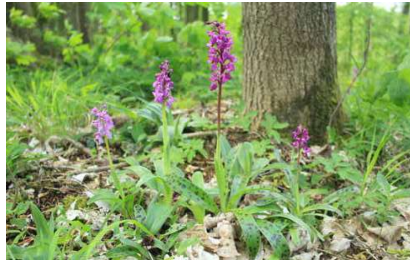
Afb. 3: De mannetjesorchis ( Orchis mascula )

steeds een historisch referentiepunt voor botanisch onderzoek. 9 De Limburgse natuuronderzoekers in deze vroege periode hadden in hun dagelijkse werk genoeg contact met de 'gewone Limburgers', maar ze vonden natuurstudie in de eerste plaats een serieuze wetenschappelijke bezigheid.