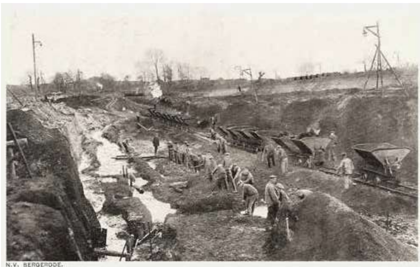
Afb. 11: De bruinkoolgroeve van de firma Bergerode op de Brunsummerheide

opgepikt door schooldirecteuren en de politie, en de gemeente Heerlen gaf ruimhartig financiële en logistieke ondersteuning. 65 De doelgroep van dit project waren kinderen van de lagere scholen en de lagere klassen van mulo, nijverheids- en huishoudscholen. Tijdens een drietal bijeenkomsten op 21 december 1955 werden niet minder dan 2125 kinderen door een gemeentebtenaar 'geïnstalleerd' als jeugdnatuurwachter. 66