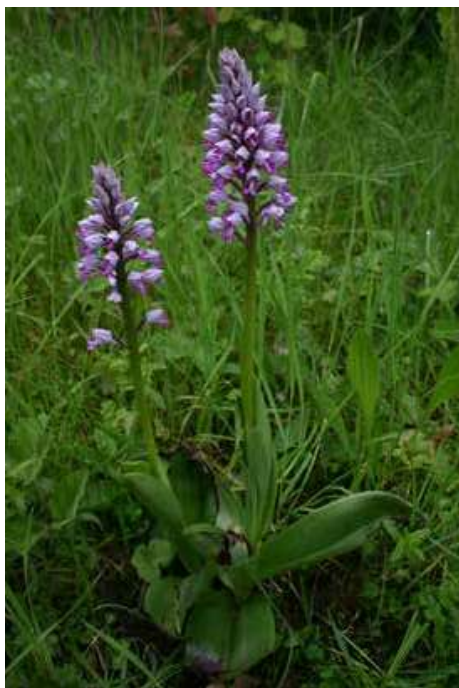
Afb. 1: De soldatenorchis of soldaatje ( Orchis militaris )