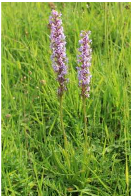
Afb. 8: De grote muggenorchtis ( Gymnadenia conopsea ) op de Kunderberg [Met dank aan het Natuurhistorisch Genootschap in Limburg. Foto: Olaf Op den Kamp]

Een artikel in het Limburgsch Dagblad gaf een beeld van het werk van de Natuurbeschermingswacht. Bruna had zich keurig geïdentificeerd met Natuurwacht-penning en legitimatiebewijs en de journalist aangeboden om hem de mooiste orchideeën te laten zien. Tijdens de tocht passeerden een bekende bloemenverkooper en een groepje leden van de socialistische Arbeiders Jeugd Centrale (AJC), die handvol lelietjes-van-dalen hadden geplukt om ze op de markt in Valkenburg te verkopen, maar van de orchideeën waren zij afgebleven. Er waren blijkbaar ook overtreders: 'twee meiskes, die te rapvoetig waren om snel genoeg door de natuurwachters benaderd te worden, gooiden in hun vlucht een handvol orchideeën weg'. 45 Maar in de meeste gevallen hoefde de 'boswachter van de bloemen' niet in te grijpen. Het publiek bleek van goede wil: veel mensen wisten gewoon nog niet