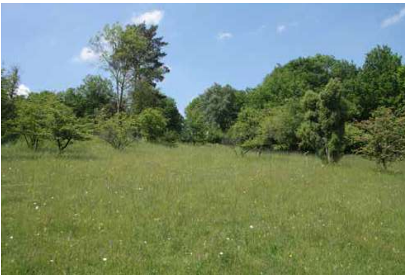
Afb. 4: De huidige orchideeëntuin in het Gerendal, onder beheer van Staatsbosbeheer [Met dank aan het Natuurhistorisch Genootschap in Limburg. Foto: Olaf Op den Kamp]

De leden van het Natuurhistorisch Genootschap in Limburg vertoonden een soortgelijke verzamelwoede. De collectie van het Natuurhistorisch Museum in Maastricht is grotendeels gebaseerd op de verzamelingen van de bestuursleden. Toch ontstond hier in 1913 een eerste debat over. Was de wetenschap wel gebaat bij het doodschieten en te pronk zetten van zeldzame vogels, als ze intussen in Limburg werden uitgeroeid? 11 In de verschuiving van ‘natuurstudie’ naar ‘natuurbescherming’ in Zuid-Limburg namen de botanici bij de NBV meestal het voortouw. Zij waren immers regelmatig in de provincie om bijzondere planten te bestuderen en te plukken, en waren dan ook de eersten die jaar na jaar merkten dat een soort zeldzamer werd. In 1928 stelde de NBV een overzicht op van bijzondere botanische terreinen in Zuid-Limburg, die in aanmerking kwamen voor aankoop door de Vereniging Natuurmonumenten. Met stip op één stond het Geuldal bij Epen, de groeiplaats van de bijzondere zinkflora. De derde vindplaats was ‘het boschcomplex Gerendal Strucht - Keutenberg, Stockemerberg.’ 12