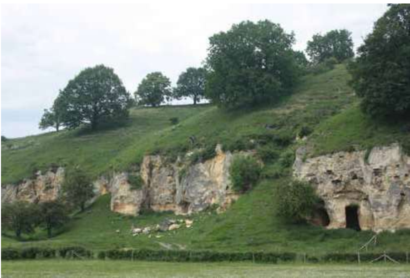
Afb. 5: De Strooberg bij Bemelen, een van de eerste aankopen van Het Limburgsch Landschap [Met dank aan het Natuurhistorisch Genootschap in Limburg. Foto: Olaf Op den Kamp]

deel van de helling van de Strooberg bij Bemelen, vindplaats van de zeldzame berggamber ( Teucrium montanum ). In 1950 volgde een ander terrein van grote botanische betekenis. Een stuk kalkgrasland van nog geen hectare groot in het Gerendal kwam voor 1600 gulden in eigendom van Het Limburgsch Landschap. Op het terrein groeiden (en groeien deels nog steeds) zo'n tien verschillende soorten wilde orchideeën. Het natuurbeheer kwam in handen van Staatsbosbeheer, dat al in 1940 was begonnen met de eerste aankopen in en rondom het Gerendal. De eerste grote aankoop van Natuurmonumenten kwam er pas in 1955. De vereniging kocht toen het landgoed Genhoes in Oud-Valkenburg, met de bijbehorende hellingbossen en delen van het Geuldal en Gerendal. 18 De aankopen waren en zijn belangrijk voor de bescherming op de lange termijn, maar in het geval van de orchideeënhellingen kwamen ze dus later, ná de invoering van de gemeentelijke plukverboden en de oprichting van de Natuurbeschermingswacht Zuidoost-Limburg in 1948.