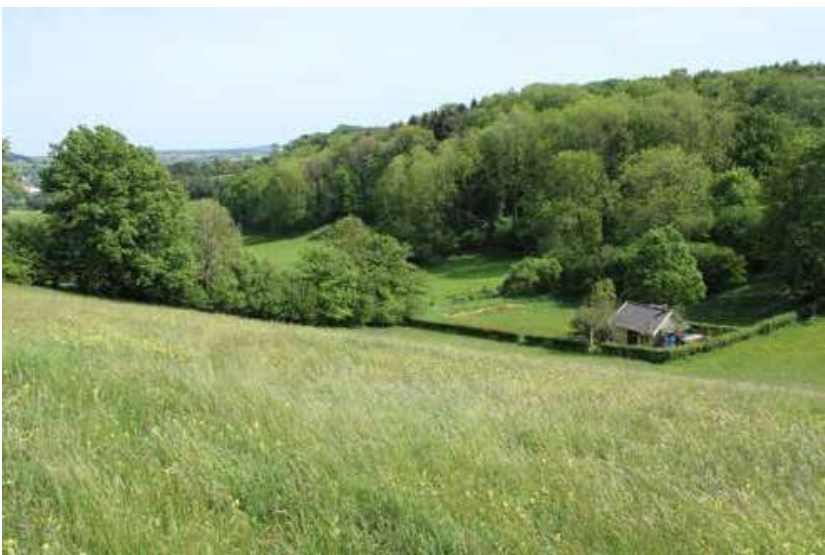
Afb. 9: De Berghofweide in de buurt van Wijlre, tegenwoordig. Rechts de wachthut

de wacht opgaven. 53 Dat wijst erop dat hij dat niet verwachtte, maar dat de Natuurbeschermingswacht ook bij sommige ‘gewone mensen’, vooral omwonenden, weerklink vond. Volgens een krantenartikel uit 1951 had de Natuurbeschermingswacht ‘haar leden uit alle lagen der bevolking gerekruteerd. Er zijn tandartsen, doktoren, biologen, geologen en leraren bij aangesloten, doch evenveel arbeiders, mijnwerkers, kleine beambten en boeren’. 54 Het is moeilijk om dat te controleren aan de hand van die eerste ledenlijst uit 1949: bij de 49 actieve natuurwachters zaten zeker vijf biologieleraren, een huisarts en een tandarts, maar van de meeste leden van de Natuurbeschermingswacht is het beroep niet meer te achterhalen.