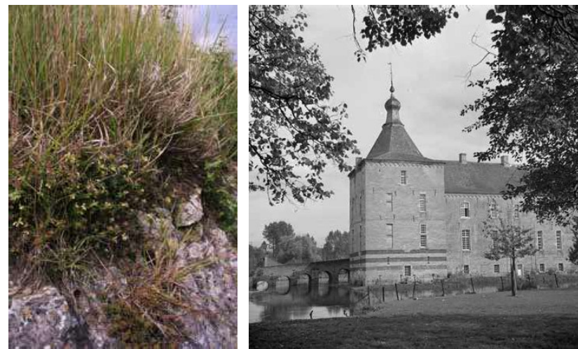
Afb. 6: De berggamber ( Teucrium montanum ) [Met dank aan het Natuurhistorisch Genootschap in Limburg. Foto: Olaf Op den Kamp]

Na de Tweede Wereldoorlog kregen de wilde orchideeën veel ongewenste belangstelling van de vele toeristen in de omgeving van Valkenburg. Ook kinderen plukten orchideeën op de afgelegen hellingen en verkochten ze vervolgens in Valkenburg op straat aan de toeristen of aan de hotels. Hoteliers plaatsten vaasjes met orchideeën op de tafels: Flora van eigen bodem als leuke attentie. 19 Bij plukken op zo'n commerciële schaal konden de gevolgen voor de flora natuurlijk niet uitblijven.