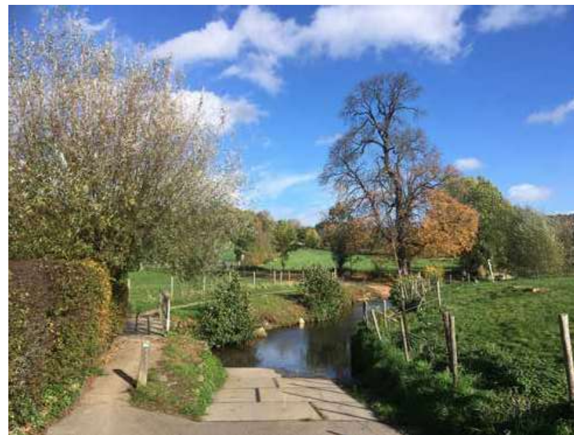
Afb. 3. Voorde in de Selzerbeek als onderdeel van het ‘ensemble Mamelis’ (gemeente Vaals) waar ruim tweeduizend jaar landschaps-geschiedenis geconcentreerd is

de voorde door de beek, de holle weg naar boven, de Romeinse villa waarvan je dakpanscherven op de akker vindt, het is de meest fantastische concentratie van ruim tweeduizend jaar geschiedenis, die alles samenvat van het Zuid-Limburgse landschap. Daar viel ik voor, voor die plek. En dat het een plek in Limburg is, zegt iets over de heel bijzondere betekenis die het onderzoeksobject daar voor mij heeft gehad en in mijn herinnering nog heeft. 30 Naar aanleiding van deze uitspraak werd een foto van de voorde van Mamelis het omslagbeeld van zijn liber amicorum .