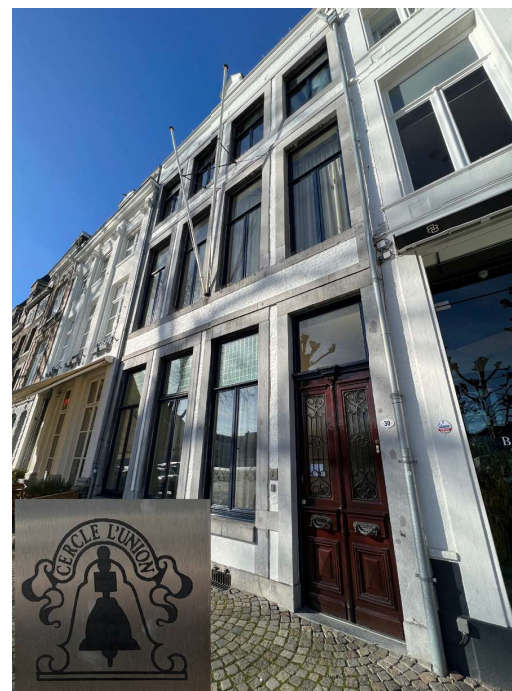
De herensociëteit Cercle l'Union op het Vrijthof in Maastricht bestaat nog steeds.