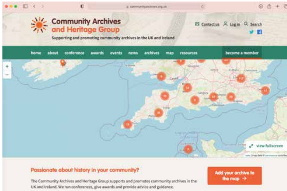
Website van de Britse Community Archives and Heritage Group.

de online protesten tegen de vaccinatiecampagne tegen baarmoederhalskanker, digitale acties in het kader van de zwartepietendiscussie en de vele digitale initiatieven die ontstaan zijn na het uitbreken van Covid-19.