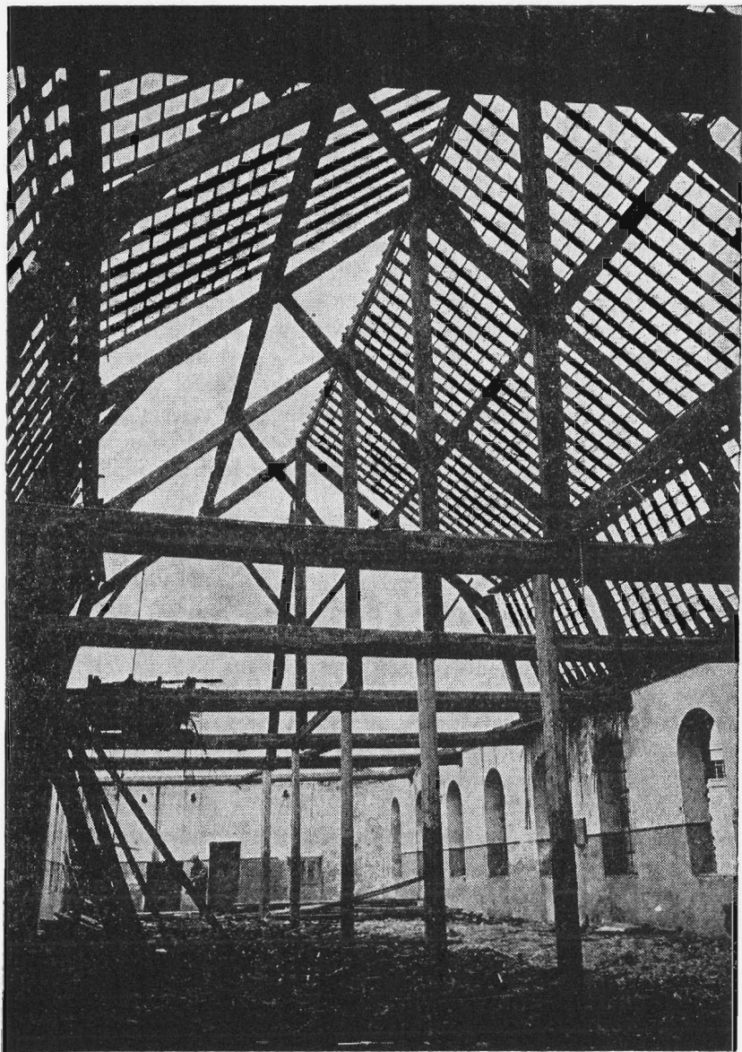
De schamele restanten van het céramiquefabriek te Hasselt