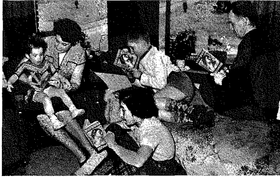
Afb. 1. Het lezend katholieke gezin. (Bron: Katholieke Illustratie , 3-4-1954).

katholieke reeksen hebben een belangrijke bijdrage geleverd aan de verspreiding van het lezen onder het katholieke volk.