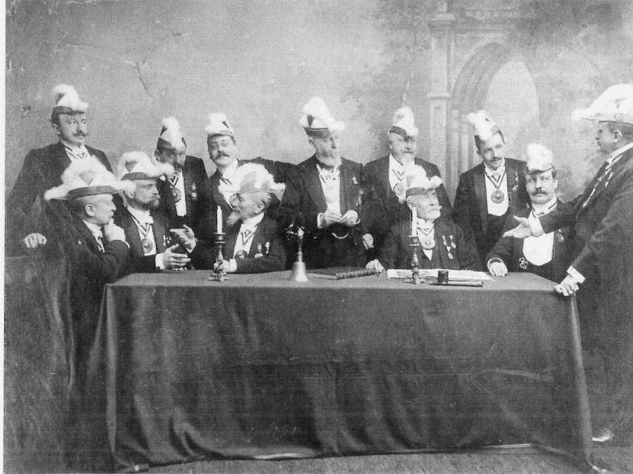
Het bestuur van de Maastrichtse sociëteit 'Momus'.