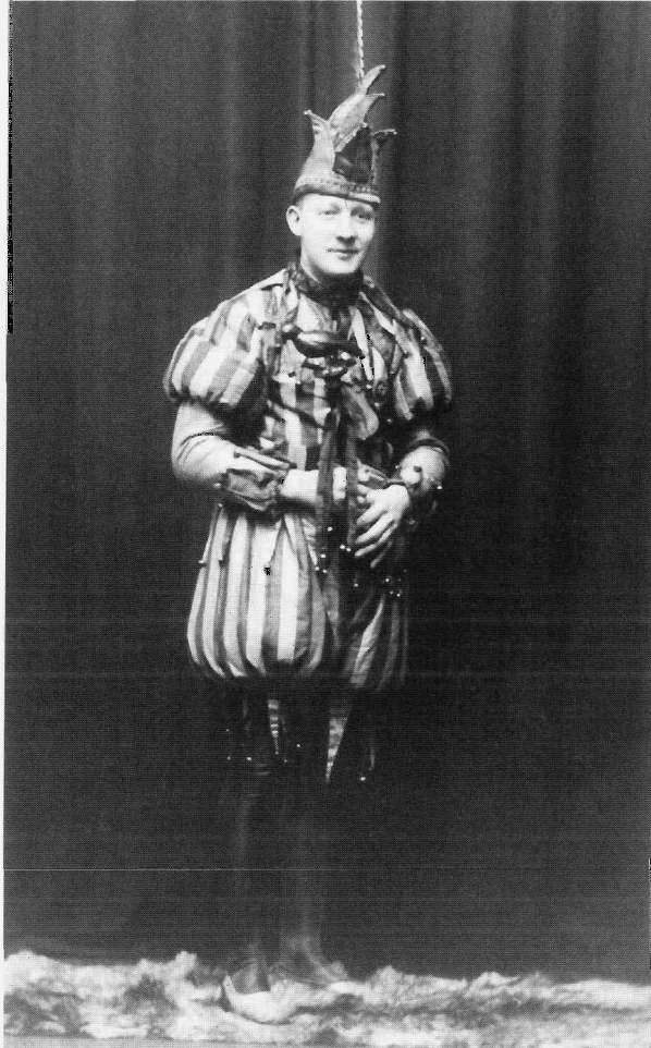
Een Sittardse prins carnaval. Foto 1928 (coll. Wilms, Gemeentearchief Sittard).

Carla Wijers In één hand de rozenkrans, in de andere hand een glas bier