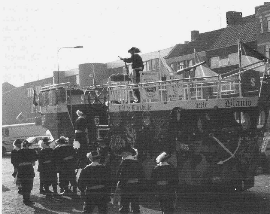
De Heerlense 'Blauwe Schuit' vaart uit en bezoekt het gemeentehuis in Brunssum tijdens het carnaval in 1989. Het huidige 'Gilde van de Blauwe Schuit' houdt 1133 aan als geboortjaar van zijn schuit, toen een scheepswagen van Kornelmünster naar St. Truiden zou zijn getrokken.