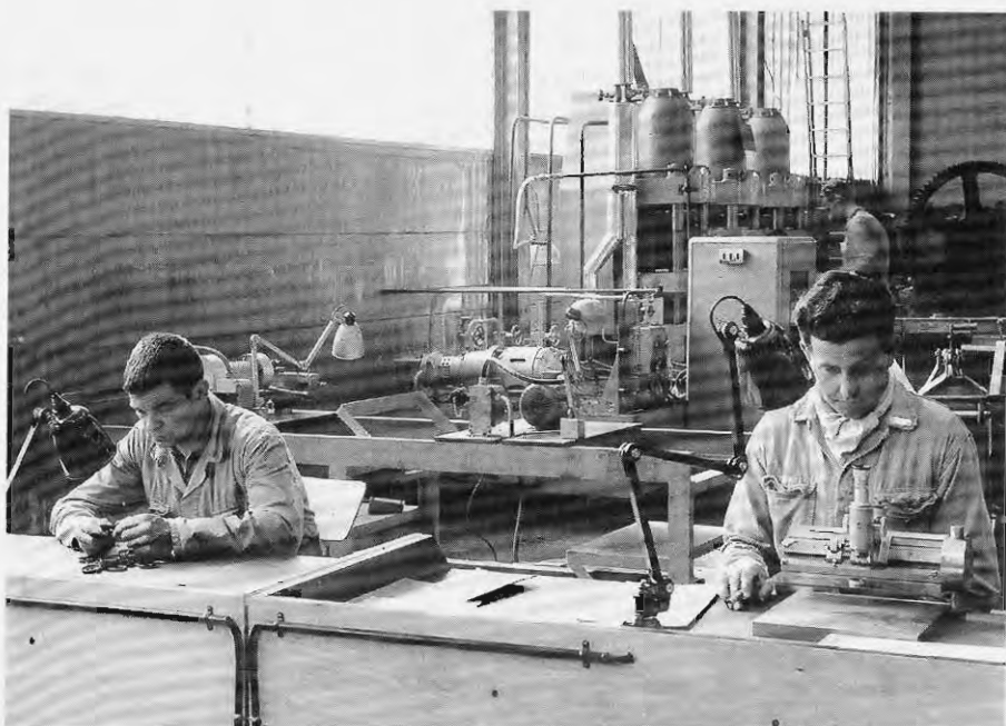
Inspectie- en controlemedewerkers bij Pionier Laura, 29-5-1969.

soortige activiteiten. De mannen konden voor hulp terecht bij de voormalige mijnwerkersbonden, het maatschappelijk werk en andere takken van het welzijnswerk.