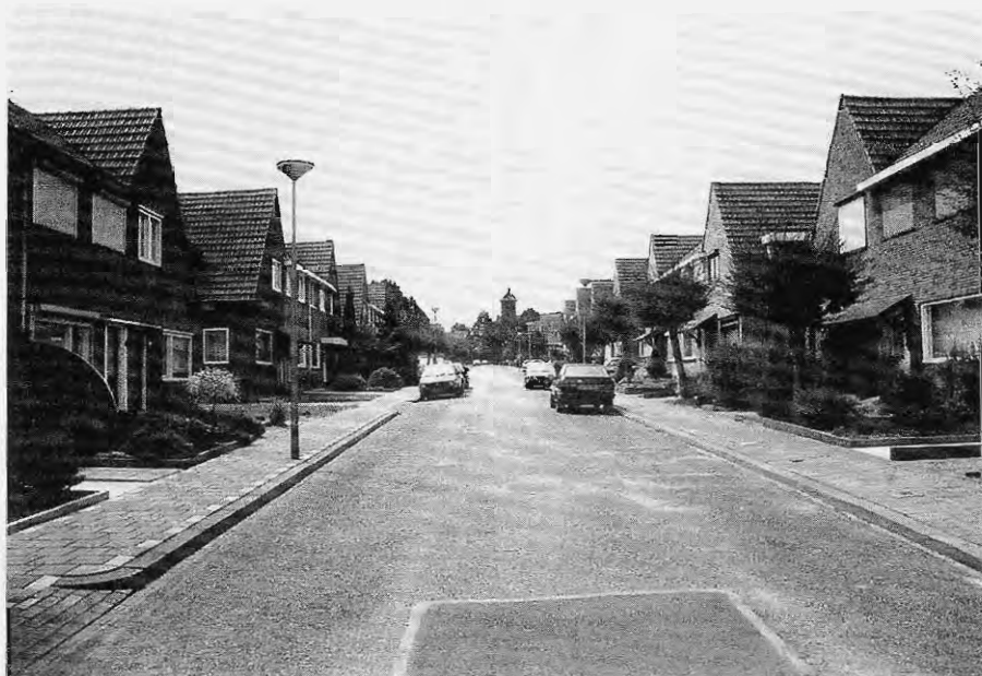
Lauradorp, 2000.

Wereldoorlog ten opzichte van dat van hun ouders. In dit opzicht week de situatie van Lauradorp af van die in het ideaaltype van Bulmer waar sprake is van sociale reproductie.