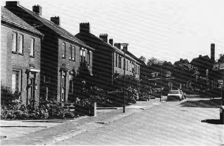
Lauradorp, 2000.

zo voor een deel. Onder de oud-mijnwerkers en de mijnwerkersvrouwen bleef zij daarentegen in sterke mate wel gehandhaafd. Zij bleven onderling functioneren als imagined community .