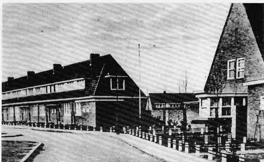
Lauradorp, 1932.

tuin, waarin het mogelijk was groente te verbouwen en kleinvee te houden. 20 In de jaren twintig werd het patronaat, het Oratorium, geopend waar paters vormingsactiviteiten voor de mijnwerkerszonen organiseerden en dat tijdelijk als noodkerk functioneerde tot er begin jaren dertig een 'echte' kerk de deuren opende. 21 Na de Tweede Wereldoorlog werd Lauradorp verder uitgebreid met ruimere maar monotoner vormgegeven woningen.