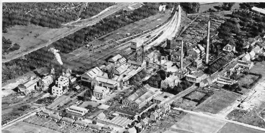
Luchtfoto van de mijn Laura, 25-09-1951.