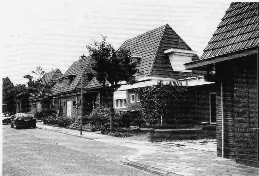
Lauradorp, 2000.

Naast deze vormen van hulpbetoon gaven de Lauradorpers elkaar soms morele steun. Het verlenen van burenhulp was voor veel Lauradorpers weliswaar een gegronde reden om bij elkaar over de vloer te komen, maar zij dienden elkaars privacy daarbij zo veel mogelijk te respecteren.