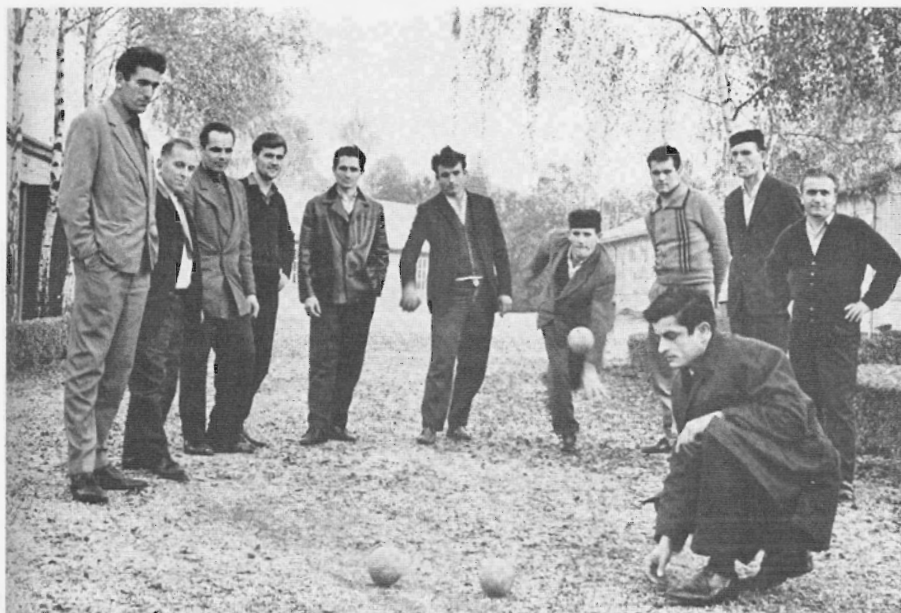
Een spelletje jeu de boules als tijdverdrif. Uit: In het goede kosthuis , uitgave van de Stichting Huisvesting Alleenstaanden 1965.

Mijnwerkers die nog niet in aanmerking kwamen voor een pensioen- of overbruggingsuitkering werden intern overgeplaatst naar eventuele nevenbedrijven of naar andere mijnen die nog wel in productie waren. Daar konden dan de arbeidsjaren tot de overbruggingsleeftijd worden vol gemaakt. De overgeplaatste oudere Nederlandse mannen die nog maar enkele jaren hadden te gaan, konden de zware mijnarbeid echter niet meer opbrengen. Om toch voldoende productie te realiseren werden de Marokkaanse ondergrondse arbeiders mee overgeplaatst. In de jaren zestig waren de mijndirecties ervan uitgegaan dat er voldoende aanbod van jongere mijnwerkers uit eigen land zou zijn om de productie op gang te houden. In de periode tussen 1965 en 1970 was daarom een groot deel van de Marokkanen gerepatrieerd. Volgens verschillende bronnen ging het om ongeveer 3.900 buitenlanders (van wie het merendeel Marokkanen). 38 Door het grote autonome verloop in de jaren 1970 en 1971 onder vooral de jonge frontarbeiders werden de mijnen echter gedwongen om opnieuw Marokkaanse arbeidskrachten aan te trekken. 39 De mijnen konden niet eerder gesloten worden omdat er dan op zeer korte termijn een grote groep oud-mijnwerkers werkloos op straat zou komen te staan voor wie nog geen oplossing was gevonden. Er werden daarom vanaf 1970 nog ongeveer 590