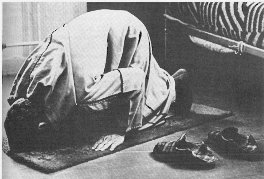
Islamitische gebeden worden in ere gehouden. Uit: In het goede kosthuis, uitgave van de Stichting Huisvesting Alleenstaanden 1965.

Nederland gekomen zonder een vermelding op hun werkkaart dat zij eerst elders in Europa hadden gewerkt, maar het staat niet vast dat die personen nooit eerder in Europa waren geweest. De werkkaarten vermelden alleen de laatste werkgever of verblijfplaats. Veel Marokkanen die in Europa werkten keerden regelmatig terug naar Marokko om na enkele maanden of jaren weer op zoek te gaan naar werk in Europa.