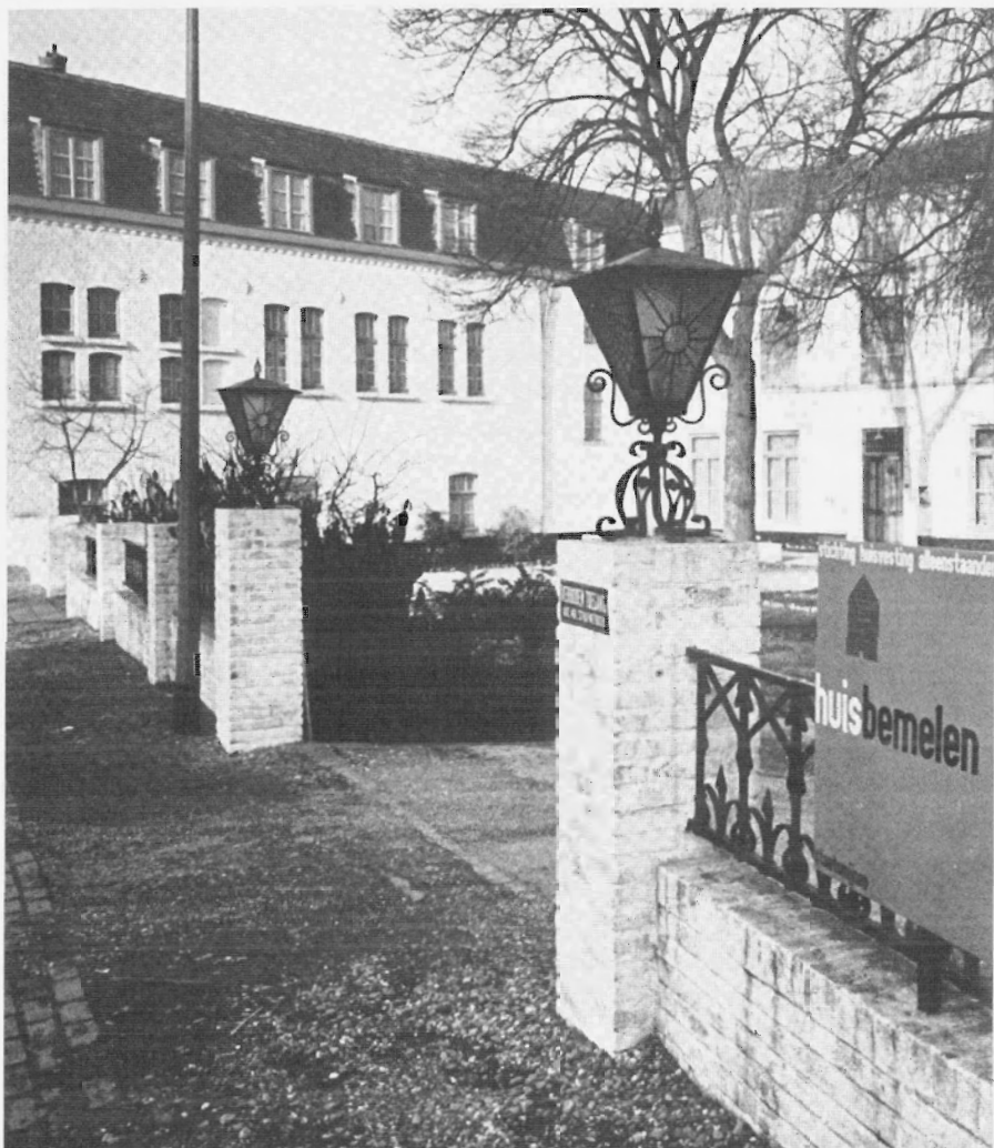
Het gezellenhuis in het dorp Bemelen. Uit: In het goede kosthuis , uitgave van de Stichting Huisvesting Alleenstaanden 1965.

maaltijden per dag te gebruiken. Hier in Nederland moesten ze het echter doen met één warme maaltijd per dag, die meestal bestond uit gekookte aardappelen, vlees en groenten. Tijdens de broodmaaltijden kregen ze veelal witbrood, kaas en jam voorgeschoteld. Een aantal Marokkanen gaf de voorkeur aan volgens islamitische wijze geslacht vlees. Het keukenpersoneel hield er wel rekening mee dat islamieten geen varkensvlees aten, maar in de jaren zestig was er in Limburg nergens een islamitische slager te vinden. Enkele Marokkanen gingen daarom in de weekends speciaal vlees en andere ingrediënten halen in één van de grote steden in het westen van Nederland. Met behulp van gekochte tweede-