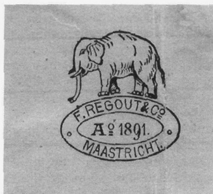
De beeldmerken van de firma Frederik Regout en Co. Beiden betwist, maar in 1892 wettig gedeponeed.