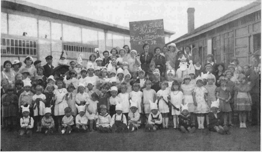
Poolse toneelklas in Zwartberg. 1934.

hun verblijf aan de Ruhr ervaring hadden opgedaan met zelforganisaties. 17 De Limburgse mijnen van hun kant voerden een 'multiculturele' politiek avant la lettre tegenover dat verenigingsleven. Ze verleenden migrantenverenigingen materiële steun en probeerden immigranten zo aan het bedrijf te binden. Dat was geen onbaatzuchtige gulheid, want zowel vreemde als Belgische mijnwerkers pleegden frequent contractbreuk, gezien de zware werkomstandigheden. In Zwartberg stelde de mijn Polen en andere immigranten daarvoor barakken ter beschikking. Ondertussen investeerden de mijnen veel meer in verenigingen die goed waren voor het bedrijfsprestige, zoals voetbalclubs en harmonieën. Deze bedrijfsverenigingen bereikten vooral Belgen van de eerste generatie en later ook migranten van de tweede generatie. Voor immigranten van de eerste generatie stonden ze niet open. De etnische scheiding in het verenigingsleven had dus, zoals de segregatie in de wijk, vooral betrekking op bewoners van de eerste generatie. 18