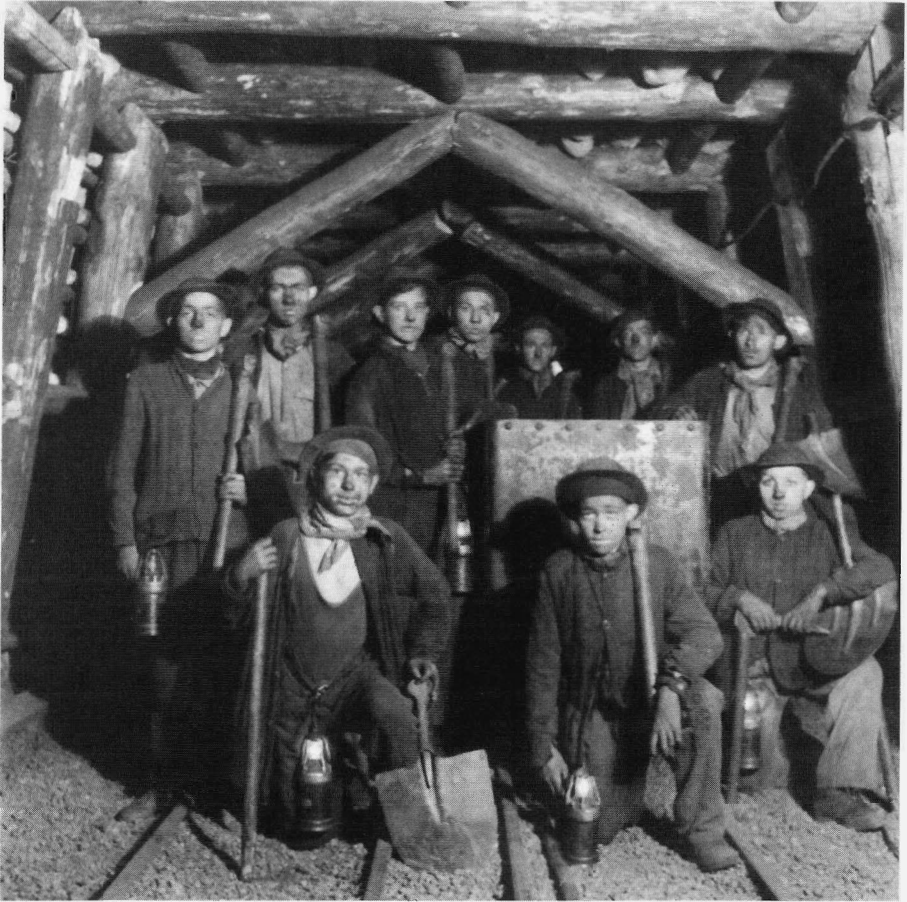
Het derde leerjaar van de mijnschool van Zwartberg. 1939-1940.

waren. 27 Op de laagste echelons werkten na 1945 Italianen en andere nieuwkomers. De Waalse leidinggevende mijnwerkers die toen hun pensioen bereikten, werden vervangen door migrantenzonen en door Vlamingen van zowel de eerste als de tweede generatie. Het tekort aan ondergronds personeel zorgde er dus voor dat, in tegenstelling tot wat de christelijke en grootste vakbond vroeg, ook migrantenzonen konden promoveren in de ondergrond. Zo beperkte de Zwartbergse mijnschool zijn campagne allerminst tot Belgische jongens. 28