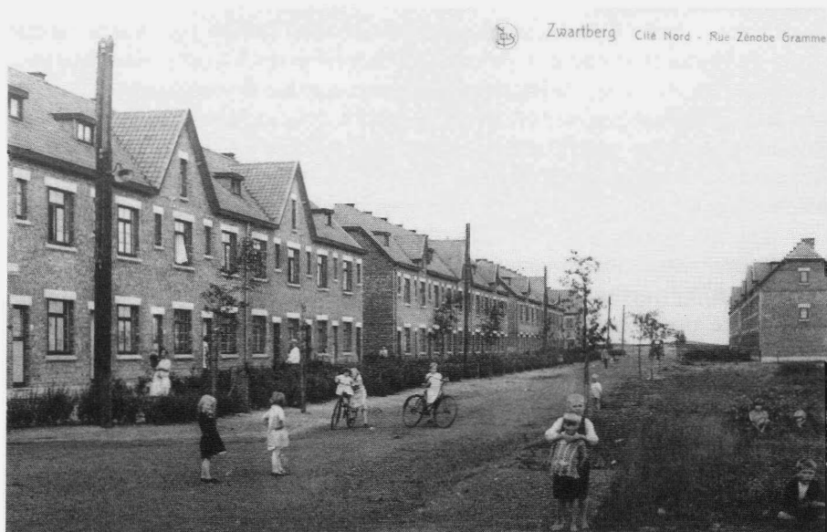
Mijnwerkersstraat in de Noordcité (oostkant) van Zwartberg.