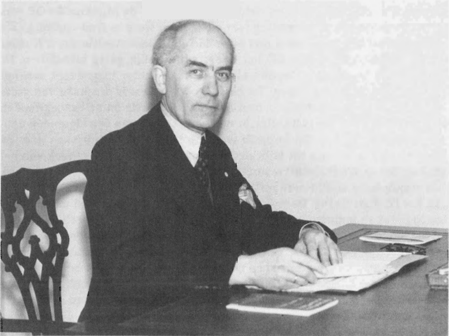
Ir F. Wijffels (1899 - 1968). Na de bevrijding was Ir Wijffels minister van Sociale Zaken, voorts was hij Inspecteur-Generaal der Mijnen, voorzitter van de Mijnindustrieraad, lid van de Eerste en de Tweede Kamer en voorzitter van de KVP-fractie in de Provinciale Staten van Limburg. Tijdens de Tweede Wereldoorlog werd ir Wijffels als gevolg van de 1 mei staking door de Duitsers gegijzeld en ter dood veroordeeld. Later werd hij vrijgelaten. De foto werd gemaakt in Arlington House, London 1945.

aan het kolenfront in de ondergrondse pijler werd, mede door de mechanisering, steeds hoger opgevoerd. Daar ook het loon van boven de mijnwerker geplaatste toezichhouders bepaald werd door deze individuele werkprestatie, was een onwaardig 'jaag- en drijfsysteem' ontstaan om de individuele werkprestatie op te voeren.