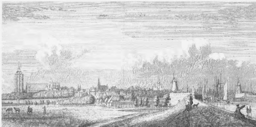
De stad Zierikzee gezien vanuit het zuiden. Kopergravure van J.C. Philips, 1743. Zeeuws Archief, Koninklijk Zeeuwsch Genootschap der Wetenschappen, Zelandia Illustrata, cat.nr. ZI-II-1897.