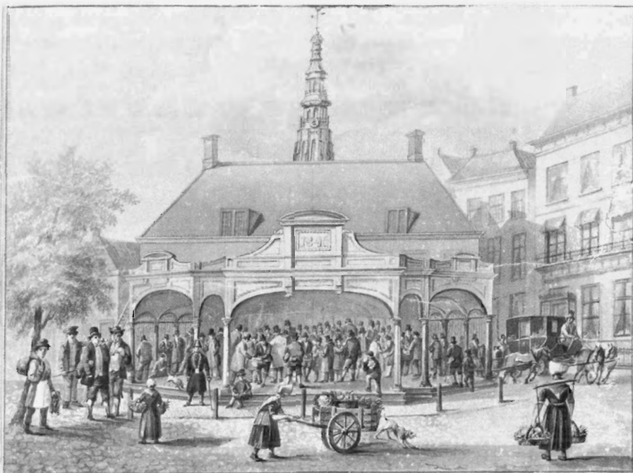
De graanbeurs in Middelburg na de verbouwing van 1846. Tekening in gewassen krijt, 1861. Zeeuws Archief, cat.nr. HTAM-052.

zelf het initiatief daartoe, omdat ze ontevreden waren met de gang van zaken en beter op de hoogte wensten te zijn van de graanprijzen. 12