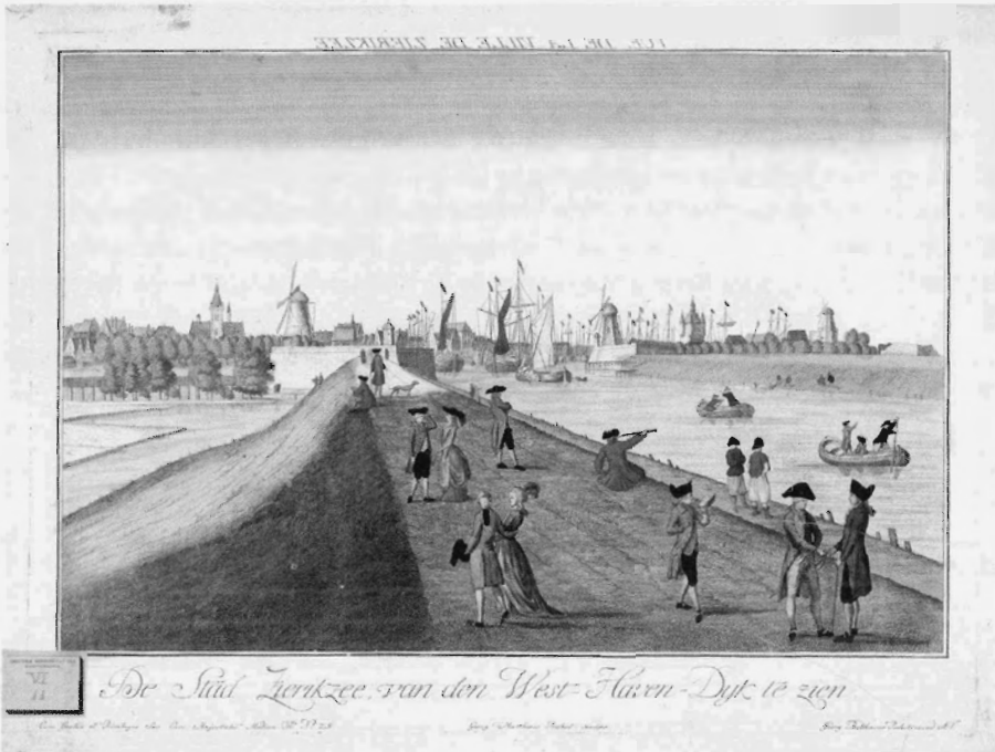
Gezicht op de stad Zierikzee vanuit de haven. Kopergravure van G.M. Probst, 1743. Zeeuws Archief, Koninklijk Zeeuwsch Genootschap der Wetenschappen, Zelandia Illustrata, cat.nr. ZI-II-1898.

Duiveland lijkt te zijn verdrievoudigd in de Franse tijd. De boeren werden een grote economische macht. De lijst van 600 hoogstaangeslagenen in de verponding, personeel- en patentbelasting van 1811 bestond voor meer dan de helft uit boeren, terwijl zij in de achttiende eeuw niet voorkwamen in de toplaag van de belastingbetalers. 26