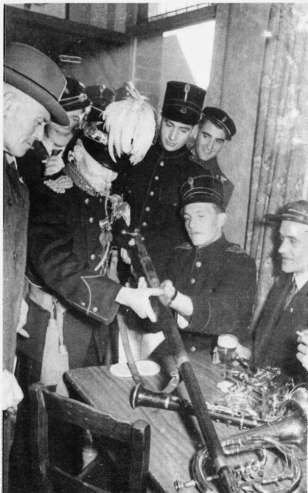
Bier, blaasmuziek en schutterij; geliefde symbolen van de 'Limburgse eigenheid'.