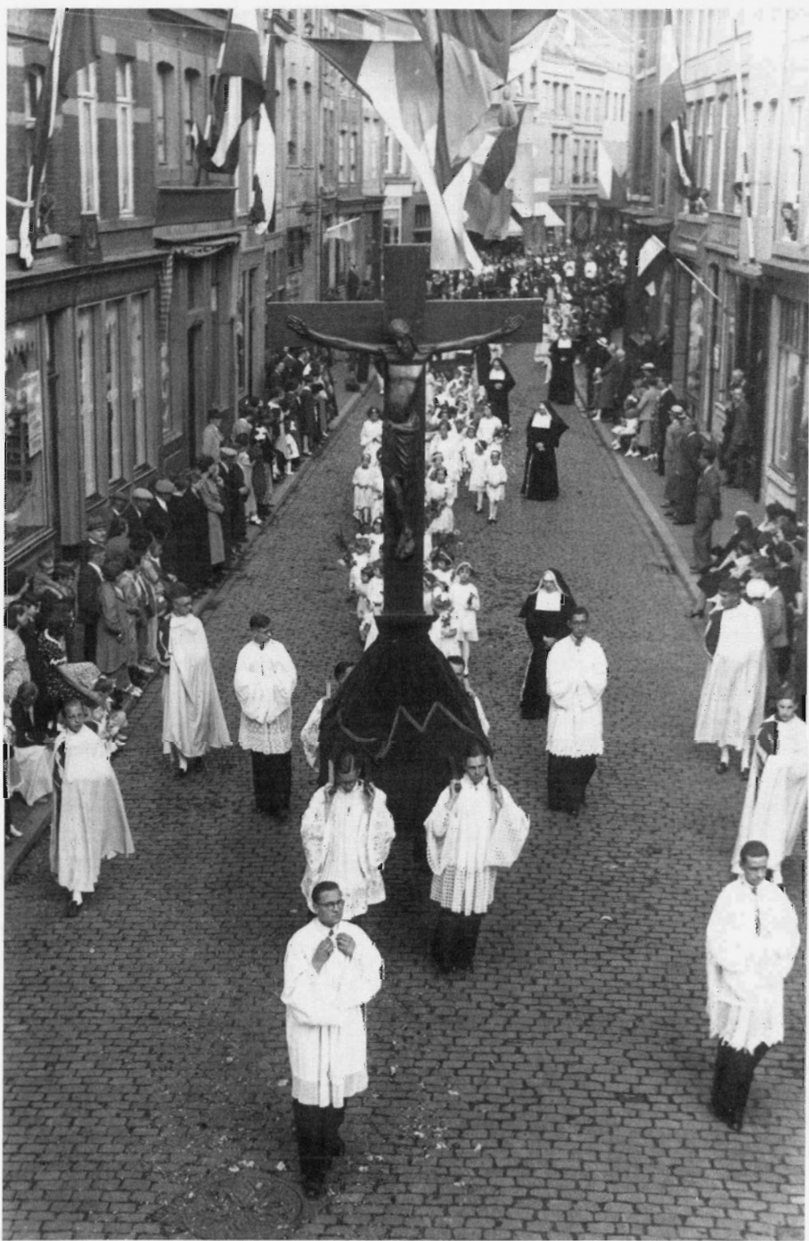
Zo ging het toen, en zo gaat het nog steeds. De 'Wieker Broonk'-processie van 1931 trekt door de Rechtstraat.