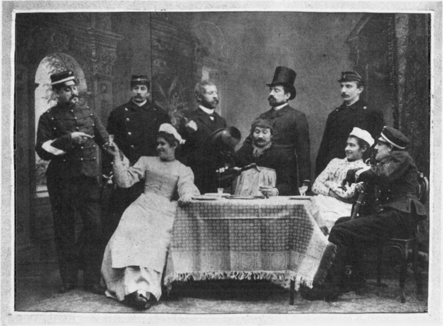
In het Limburgs vertaalde Franse toneelstukken hadden veel succes in Maastricht. Hier de 'Kemediespeulers' van de Momus bij de uitvoering van een stuk van Molière, ca. 1910.

De gewaarwording dringt zich op dat in de loop van de negentiende en vroege twintigste eeuw zulke initiatieven meer en meer de zelfbenaming Limburgs gaan bezigen en aldus hun stadscultuur en -sociabiliteit in een gezamenlijk Limburgs kader plaatsen. De ad hoc geconstrueerde bestuurlijke eenheid van 1815/1839 werd aldus geconcretiseerd, in beeldvorming en als cultureel referentiekader: de stadsculturen van Venlo, Roermond, Sittard, Valkenburg en Maastricht zagen zichzelf als onderdeel, niet in eerste instantie van 'Nederland', maar vooral van een gezamenlijk 'Limburg'. In de loop van de negentiende eeuw zien we navenant hoe de diverse toneelgezelschappen in de respectieve Limburgse steden vaker op regionaal/provinciaal vlak uitwisselingen, ontmoetingen en transfers ondernemen: gastoptredens, regionale concoursen, samenwerking tussen de Roermondse Société dramatique en de Maastrichtse Momus , en de 'export' van Franquinets blijspel 't Kindermäögske naar een Roermondse productie onder de titel 't Mestreechs kindermäögske . 29 In onderscheid tot andere steden in den lande kon het regionale aggregatieniveau tamelijk succesvol concurreren met het landelijke als het ging om de culturele schaalvergroting en de zich verbredende socioculturele horizon. Zowel op het grotere landelijke niveau als op het subsidiaire Limburgse niveau vond een eenwordingsproces plaats