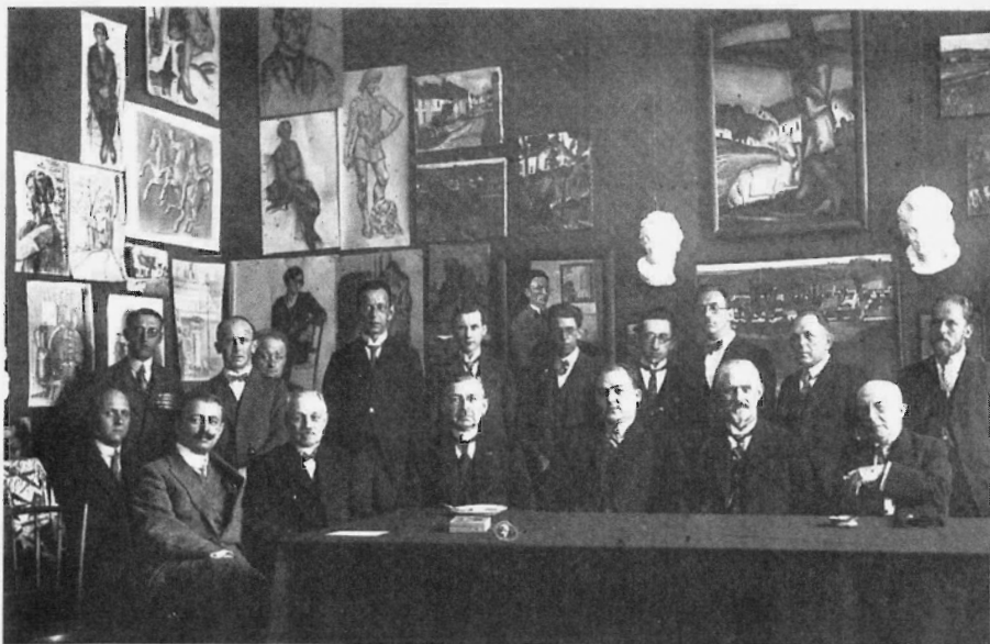
Het bestuur van het eerbiedwaardige Limburgs Geschied en Oudheidkundig Genootschap bij de viering van het 65-jarig bestaan, 1917.

de Nederrijn vindt een ware wildgroei aan Bismarck- en Keizer-Wilhelm-monumenten plaats. 20