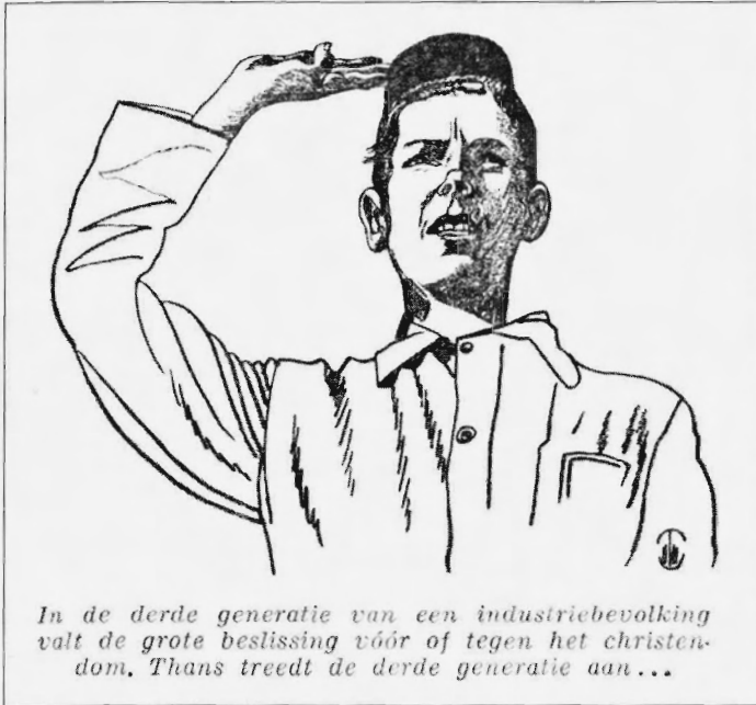
De christelijke Mijnstreek, het werk van dr. Poels, moest behouden blijven. Bron: De Mijnwerker, 1958.

Langzaam ontstaat de situatie dat men steeds meer vreemde arbeidskrachten als Polen, Hongaren, Joego-Slaven, Italianen aan moet trekken en het in de naaste toekomst waarschijnlijk zelfs noodzakelijk wordt Marokkanen te ronselen met al de gevolgen van dien. Wat zal als gevolg daarvan de toekomst aan Limburg brengen, op geestelijk, cultureel, sociaal en materieel gebied? Zal het werk van dr. Poels, de christelijke mijnstreek, behouden blijven met de dingen daardoor op cultureel en godsdienstig gebied bereikt? Als we dit overwegen begrijpen we, dat hier toch wel zeer grote belangen voor de mijnwerkers liggen. 85