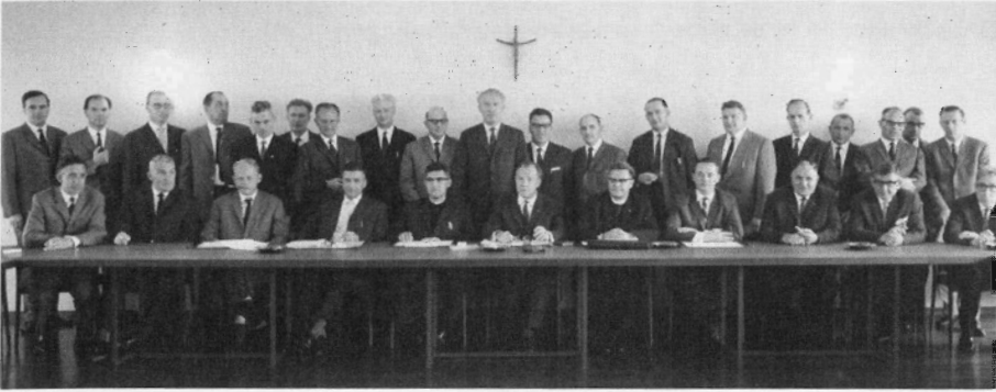
Het voltallige bondsbestuur van de Nederlandse Katholieke Mijnwerkers Bond, ca. 1960.