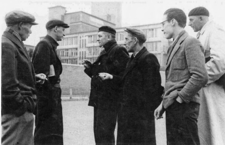
Limburgse mijnwerkers tijdens de langzaam-aan-actie van 1957.