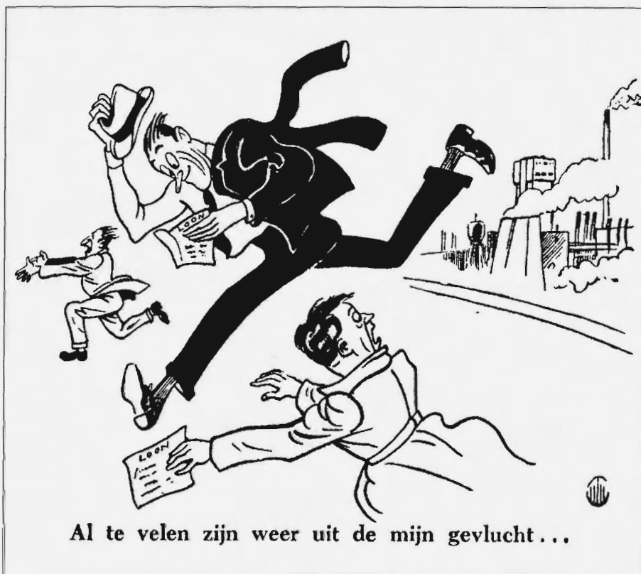
Spotprent op de groei van het aantal pendelaars naar de Duitse mijnen.