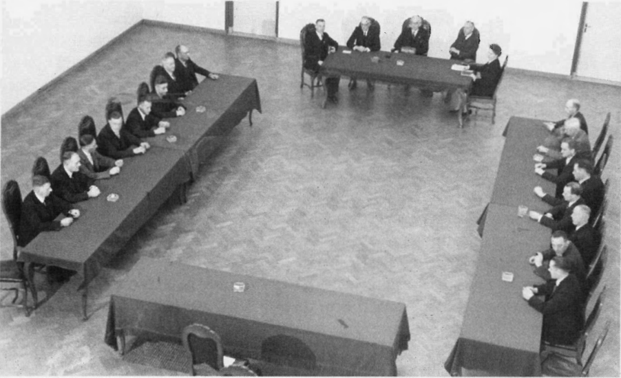
Beeld van de installatie van de Mijn Industrie Raad op 18 oktober 1945.

Door het systeem van strak geleide loonvorming waren de marges voor de vakbonden op bedrijfstakniveau, zoals gezegd, klein en dat gold ook voor de mogelijkheden van de MIR om als PBO-orgaan lonen en arbeidsvoorwaarden in onderling overleg vast te stellen. In feite kon dit alleen functioneren zolang de contractpartijen, of 'bedrijfsgenoten' zoals zij in het PBO-jargon heetten, zich conformeerden aan de uitgangspunten van de centraal vastgestelde loonpolitiek. Aanvankelijk had de NKMB zich zonder morren aangesloten bij de loonpolitiek van de KAB en de regering. In 1951 bijvoorbeeld organiseerde de NKMB een propagandacampagne onder de leden voor acceptatie van een 'bestedingsbeperking', waar de KAB op landelijk niveau mee had ingestemd. 19 Toen kon de NKMB zich nog verenigen met de geleide loonpolitiek en de uitkomsten van het centraal overleg. In 1957 was dat niet meer het geval. Voor het antwoord op de vraag hoe dat kwam, moeten we kijken naar de ontwikkelingen op de regionale arbeidsmarkt.