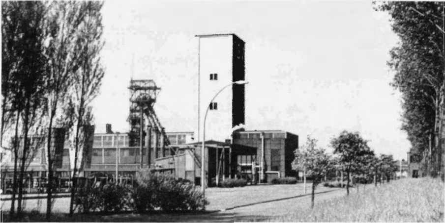
De Emil Mayrisch in Siersdorf, Duitsland, ca. 1956.

de krant, om de 'bestgeschoolde ondergrondse krachten' 37 De meeste trokken naar de Emil Mayrisch in het Akense Siersdorf, die in 1948 in bedrijf was gekomen en in 1957 fors werd uitgebreid. Daar waren volgens een ander bericht in september 1957 800 Limburgers aan het werk. Het zou echter niet alleen gaan om personen die tot voor kort op Limburgse mijnen werkten, maar ook om Limburgse mijnwerkers die van Belgische mijnen naar Siersdorf waren gegaan, en om Nederlanders die al in Duitsland woonden. 38 Ongeveer 600 mijnwerkers zouden rechtstreeks van de Nederlandse mijnen zijn gekomen. 39