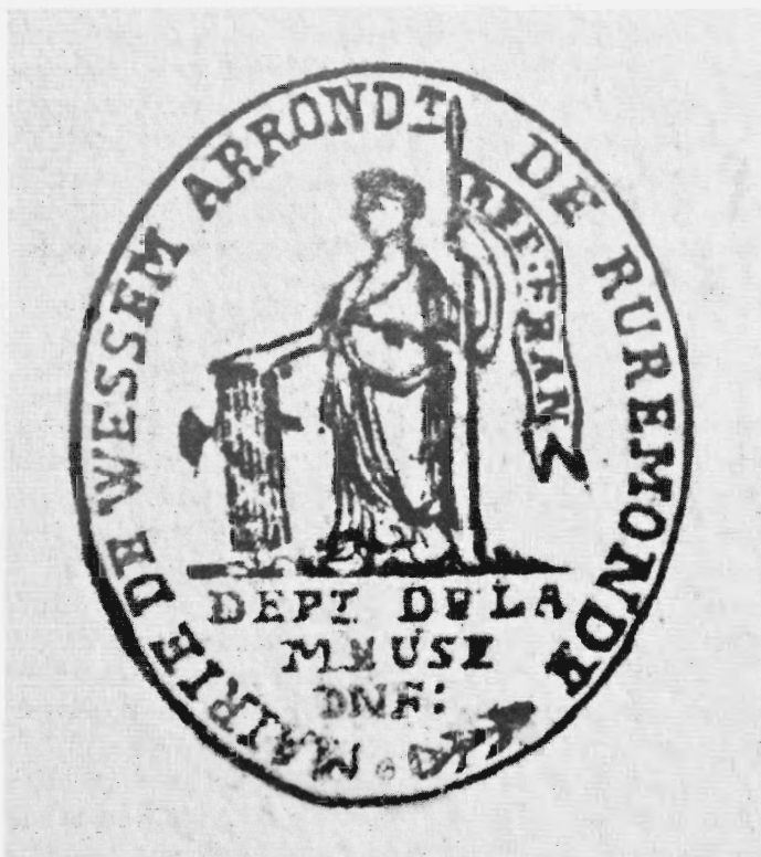
Stempel van de Franse gemeente Wessem. Regionaal Historisch Centrum Limburg, Nieuw Rechterlijk Archief.

naar de douane. 39 Er waren ook minder legale vormen van integratie. Zo verwekte Louis Grouselle, luitenant der douane, een onwettig kind bij een vrouw uit Stramproy. 40 Ook treffen we douaniers aan in het gezelschap van prostitutees. 41 De openbaar aanklager in het departement Nedermaas verzuchtte in een brief aan de minister van justitie: 'op het gebied van de zeden hebben douaniers van de lagere rangen in het algemeen geen goede naam'. 42