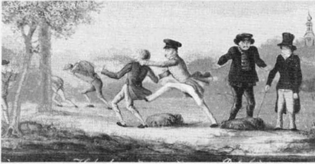
Arrestatie van een aantal lompensmokkelaars.

de weer met het verzorgen van hun paarden. De douaniers treffen 34 kisten met kandijnsuiker aan, honderddertig broden suiker en negen balen cacao. In diverse tuinen in Maasbracht vinden ze daarnaast nog zes balen tabak en enkele broden suiker, die smokkelaars daar hebben achtergelaten. De douaniers huren vier wagens met paarden om alle kisten, balen en losse broden mee te nemen naar het douanekantoor van Neeritter, op de linkeroever van de Maas. Ten kantore wegen ze de in beslag genomen goederen, waarbij ze uiteraard het nieuwe metrieke en decimale stelsel hanteren. De oogst komt uit op 675 kilo kandijnsuiker, 225 kilo witte suiker, 221 kilo cacao en 105 kilo tabak. Van de inbeslagname stellen de douaniers proces-verbaal op, in naam van de hoofddirectie in Parijs, zoals de richtlijnen voorschreven. 6