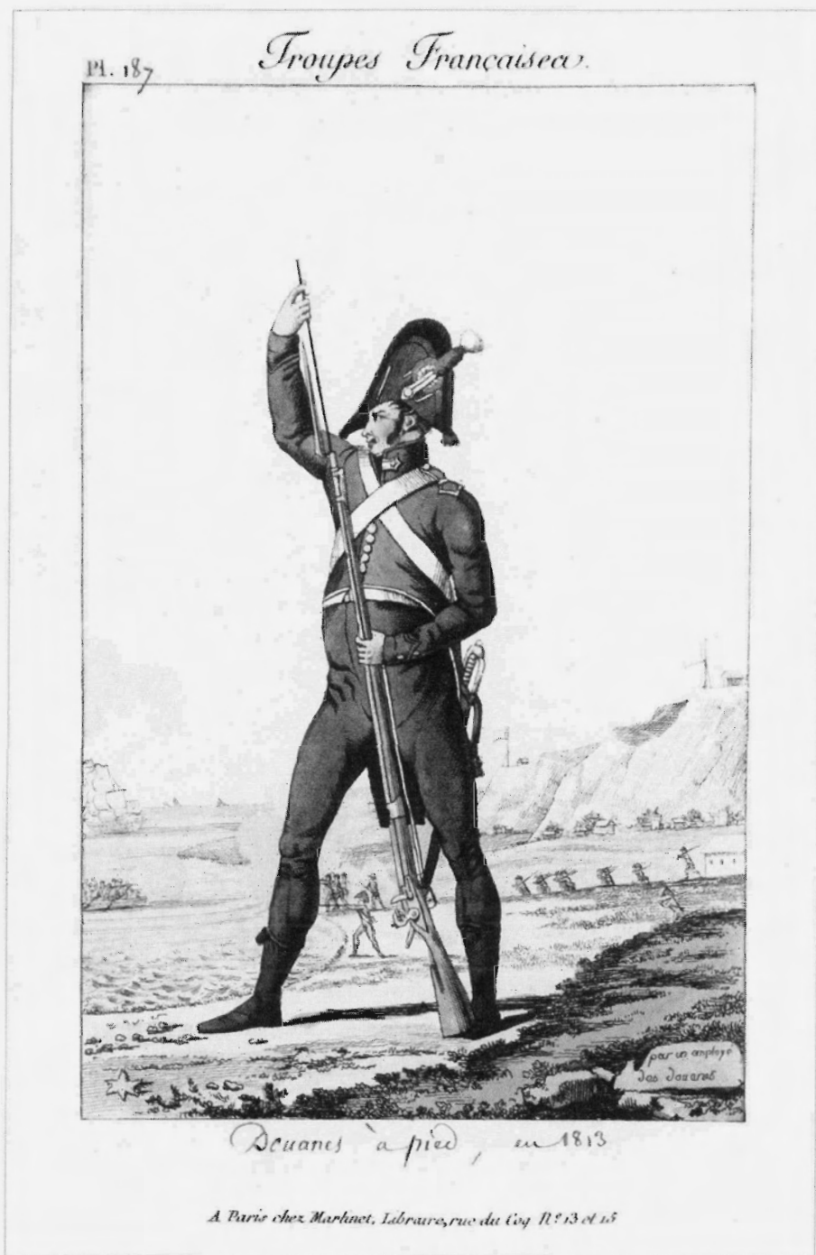
Fransse Douanier te voet. Onder Napoleons bewind werden douaniers verplicht tot het dragen van een groen uniform. Gravure van Martinet.