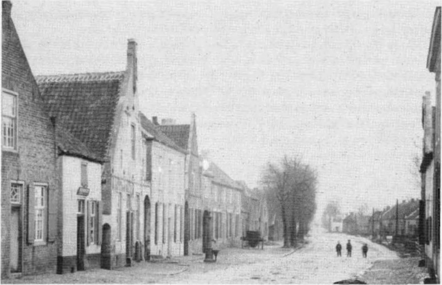
De Maaspoort in Weert, gezien vanaf de Maasstraat, aan het einde van de negentiende eeuw. De Maaspoort, die net buiten de stadswallen lag, was een uitvalsweg richting Stramproy en Maaseik.

Als lokkertje voor de douaniers die hen achtervolgen, laten ze onderweg vier balen achter. Het is een afleidingsmanoeuvre die op het repertoire van elke smokkelaarbende staat. De smokkelaars hopen dat douaniers zich ontfermen over deze buit. Meestal zijn de douaniers zoveel tijd kwijt met het in verzekerde bewaring stellen van het strooigoed, dat ze de smokkelaars uit het zicht verliezen. De smokkelaars kunnen dan het hoofdbestanddeel van de smokkelwaar in een opbergplaats deponeren, zonder verder nog gestoord te worden door de douaniers.