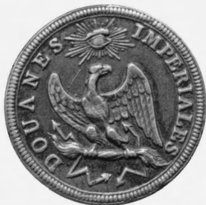
Knoop van de uniformjas van een Franse douanier ten tijde van Napoleon. De keizerlijke adelaar was het symbolische gezicht van de douane.

Bataafse Budel en het Franse Bocholt mishandeld. Er was hier een zorgvuldige plaatsbepaling nodig om vast te stellen in welk land het vergrijp zich had voorgedaan. 34