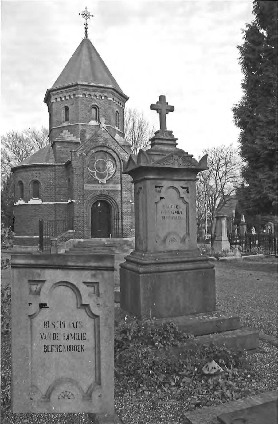
Isabella Beerenbroek vond haar laatste rustplaats in het familiegraf in de begraafklasse I, dichtbij het centrale punt van de begraafplaats 'Nabij Kapel in 't Zand', de Bisschoppenkapel.