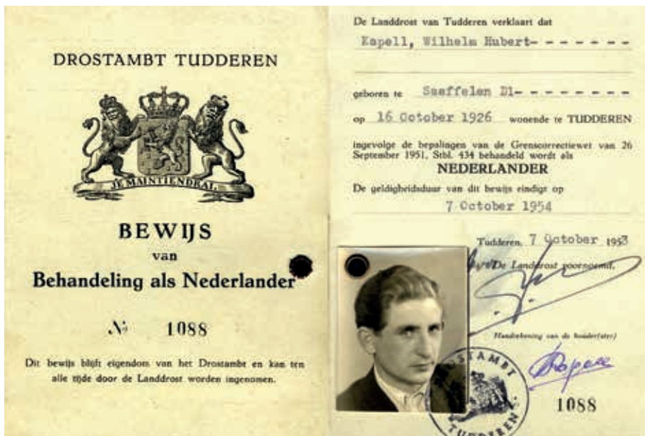
Een behandelings-Nederlander kreeg geen echt Nederlands paspoort, maar wel een bewijs dat hem of haar een behandeling als Nederlander garandeerde.