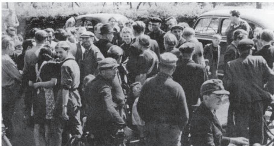
Een oloppeje tijdens de Nederlandse inbezitneming van de Selfkant, 23 april 1949. Uit: Rüdiger Haude, Geschichte im Westen, Zeitschrift für Landes- und Zeitgeschichte 27 (2012).

als raadsadviseur op het ministerie van justitie, maar hij werd destijds nog wel frequent geconsulteerd over lastige onderwerpen. 21 Ook in 1949 werkte hij al op dat ministerie. En zoals zo-even reeds vermeld, was hij het ook die in 1963 de vergelijking met de positie van 'Status-Duitsers' maakte.