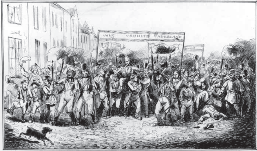
Tijdens een volksdemonstratie voor democratische hervormingen op 16 maart 1848, werd de radicale publicist Adriaan van Bevervoorde op de schouders door de straten van Den Haag gedragen. Prent, collectie Spaarnestad Photo.