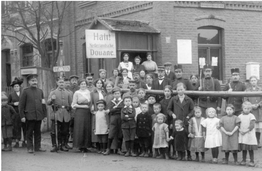
Vlak na het uitbreken van de Eerste Wereldoorlog poseren grensbewoners en grenswachters aan de gesloten grensovergang bij Pannesheide in Kerkrade, november 1914.