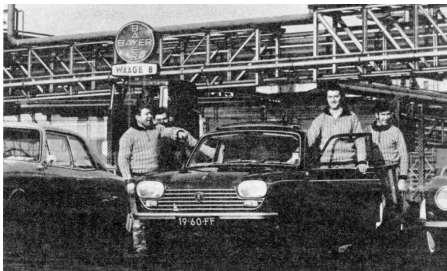
Nederlandse grensarbeiders met hun auto voor een Duitse fabriek, begin jaren 1970.

echter steeds hoger dan dat van de grenspendel. Zelfs in het uitzonderlijke jaar 1973 was het aandeel van grensarbeiders naar Duitsland alleen in de Oostelijke Mijnstreek hoger dan dat van de binnenlandse pendelaars (11 tegenover 6 procent). Zeker als we in aanmerking nemen dat de voordelen van werken in Duitsland in dat jaar heel groot waren, zowel wat betreft de werkgelegenheid als de lonen, blijkt daaruit duidelijk dat grensarbeid niet een 'natuurlijke' of 'bekende' oplossing was om de werkloosheid in de Limburgse mijnstreken te ontlopen. Dit blijkt des te meer uit de omvangrijke emigratie naar andere delen van Nederland in dezelfde periode, met name uit de Oostelijke Mijnstreek. 24