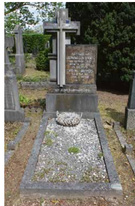
Graf Straus (1937).