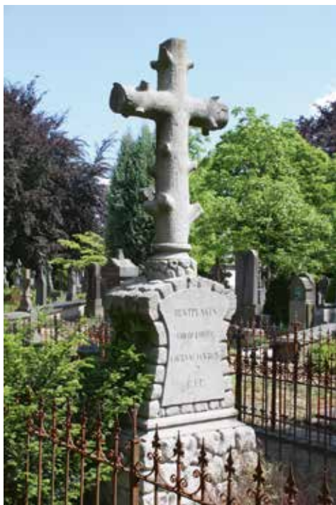
Graf Lockum-Van Bun (1884).

Het grafmonument bevat diverse kenmerken die typerend zijn voor de Heimatkunst , zoals de rusticaverbanden (onregelmatig in de sokkel, regelmatig in het middendeel en de sokkelzone van het takkenkruis) en het schijnbaar uit een boomstam gegroeide takkenkruis.