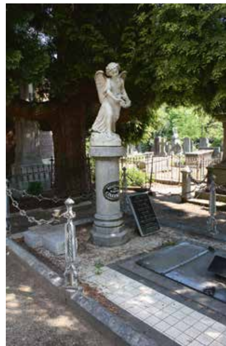
Graf Cillekens (1883).

Het graf is verder omzoomd met een afzetting, gevormd door een recentelijk vernieuwde border van geprofileerde hardsteen (in doorsnede vierkant met daarboven een stompe driehoek als een huisje met een zadeldak), onderbroken door vierkante basementen voor ijzeren pijlers, ieder bestaande uit een in het midden deel getordeerde kern met daar omheen over de hele hoogte vier ornamenten uit deels gebogen platijzer, boven en onder ingesnoerd om een sokkel, middendeel en top te vormen, eindigend in een sierknop. Tussen deze pijlers hangt een metalen sierketting, bestaande uit afwisselend ruitvormige en toegeknepen langwerpige schakels. Deze ketting sluit het monument echter niet geheel af. Binnen de hardstenen border vinden we verder een witte tegelvloer, afgezet met een rand blauwe tegels langs de border en langs de metalen toegangsdeur tot de grafkelder. Deze deur heeft een hartvormige ijzeren greep en een ontluchtingsgat. Tenslotte staat op de tegelvloer nog een aparte marmeren plaat van recente datum, met daarop een lijst van personen die in de grafkelder zijn begraven.