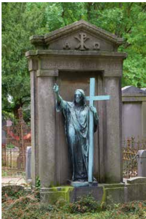
Graf Willemsen (1882).

Het Christusbeeld op het familiegraf Willemsen werd geleverd door een bedrijf in het Duitse Geislingen an der Steige, dat zich had gespecialiseerd in grafbeelden volgens de in die tijd nieuwe Galvanotechniek en een ruim afzetgebied had. 20