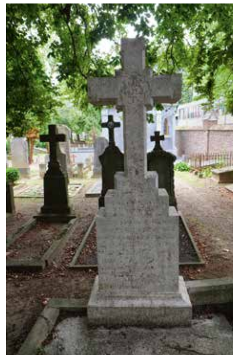
Graf Berentzen (1902).

van een 'prachtig gesmeed ijzeren hek' en stelde 'dat veel gedaan wordt voor de nagedachtenis onzer overledenen'. 40