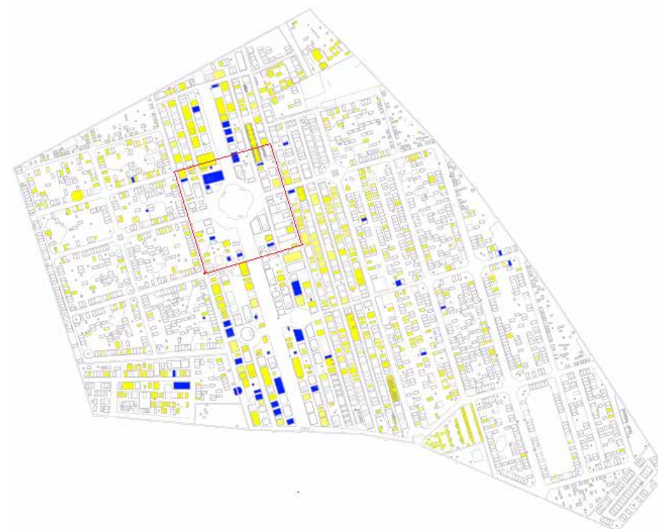
Kaart 4. De ligging van neoclassicistische en neogotische grafmonumenten op de begraafplaats. Op deze kaart is duidelijk te zien dat de directe omgeving van de Bisschoppenkapel niet kan worden beschouwd als het exclusieve terrein van één bepaalde grafstijl.

grafmonument begraven. Klerikalen zagen het neoclassicisme niet als een ‘heidense’ of protestantse stijl en werden niet vaker dan liberalen begraven in de nabijheid van de Bisschoppenkapel. De directe omgeving van deze kapel kan ook niet worden beschouwd als het exclusieve terrein van één bepaalde grafstijl (zie kaart 4). Hoewel niet vastgesteld kan worden in hoeverre de graflocatie het gevolg was van een bewuste keuze en overledenen vaak werden bijgezet in een reeds bestaand familiegraf, kan worden geconcludeerd dat de politieke dimensie, die Stöcker en Meyer-Woeller in het Rijnlandse begraven zien, in Roermond ontbrak. Bij het begraven op de Roermondse begraafplaats, dat wil zeggen bij de al dan niet bewuste keuze voor grafstijl en -locatie, speelden praktische motieven, zoals de beschikbaarheid van een geschikte locatie, een grotere rol dan religieuze en