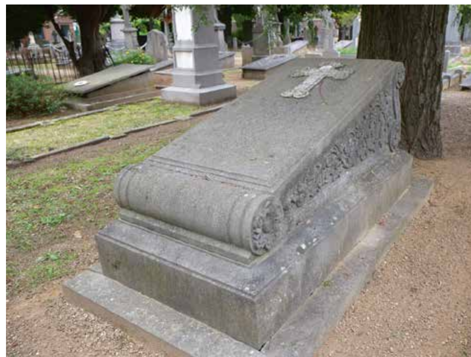
Graf Stengele (1885).

Dit in zandsteen uitgevoerde grafmonument is een van de meest atypische monumenten op de begraafplaats. De sokkelzone ervan bestaat uit een dorpel met daarboven een aan de bovenzijde inkragende sokkel, beide zonder verdere ornamentering. Daarboven treffen we een middendeel, dat qua vorm een vlak oplopend rustbed met kussenzones boven en onder imiteert. De achterzijde lijkt inderdaad als een gebogen rugstijl eindigend in twee voluten uitgevoerd te zijn. Op het 'kusseneinde' aan de zijkant zien we in totaal zes rozetten met zes bladeren rond een rond bloemenhart. Verder zijn deze 'kussens' vlak, met uitzondering van eenvoudige lijnvormige profileringen, die parallel aan de eindes lopen. De beide zijden van dit 'bed' zijn omlijst, en binnen deze lijsten zien we gestileerde wingerdranken. De achterzijde is, behalve de kussenzones, verder niet gedecoreerd. Tenslotte vinden we op de bovenzijde een kruis met aan de kruiseinden uitbottende, telkens zes in twee gespiegelde cirkelvormen groeiende acanthusachtige ranken, alsook een grotendeels onleesbare inscriptie.