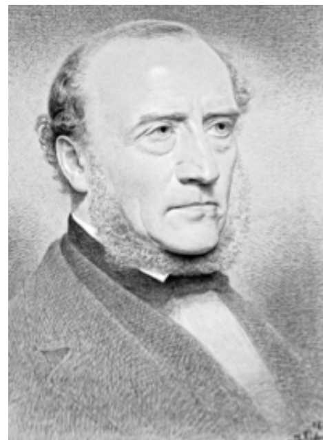
August Reichensperger (1808-1895)

Veel tijdgenoten zullen geen kennis hebben genomen van Reichenspergers opvattingen of – zo dat wel het geval was – zich er weinig van hebben aangetrokken. Aan het begin van de negentiende eeuw keken goed opgeleide burgers vol bewondering naar de vormen uit de klassieke Oudheid. Ze brachten hun groeiende zelfbewustzijn tot uitdrukking in klassiek vormgegeven grafmonumenten op nieuwe, buiten de steden aangelegde begraafplaatsen. Deze ontwikkeling bereikte een climax in het laatste kwart van de negentiende eeuw. 44 Op de Roermondse begraafplaats is ze zeer herkenbaar (zie kaart 1).