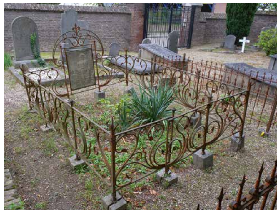
Graf Doijer (1908).

Deze bestaan uit slingerende ranken, eindigend in bladvormen of een golvend meeldraadachtig rankeinde. De spijlen, die de rechthoekige velden markeren, worden getopt door knopvormen die op vierkante nagelkoppen lijken; op de vier hoekspijlen van het hekwerk zijn deze knopvormen vervangen door grotere, klauwachtig aandoende florale motieven. Aan de achterzijde van het graf bevindt zich, ingewerkt in het hekwerk, een plaat van een composietmateriaal. Hierop staat de tekst 'Rustplaats van de Familie Doijer-Kromhout'. Deze plaat, alsook de omlijsting en bekroning ervan met ijzeren ranken, steekt uit boven de velden waaruit de rest van het hekwerk is opgebouwd.