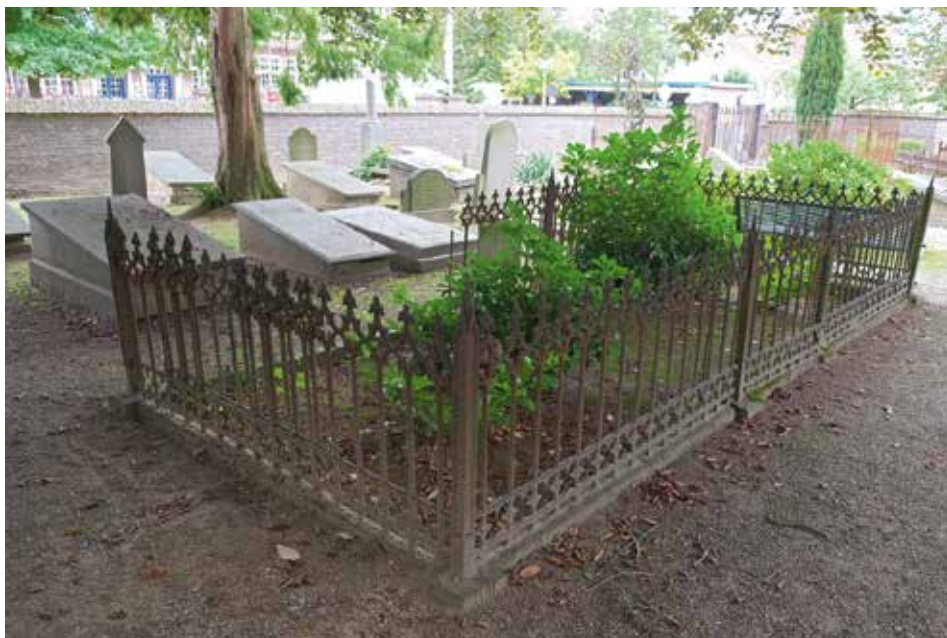
Graf Claus (1879).

worden aangetroffen. Het lijkt er sterk op dat de bestempeling tot stijl van het katholieke reveil de neogotiek tot een ongewenste stijl maakte voor protestanten en joden, terwijl katholieken er tegelijkertijd geen probleem mee hadden te kiezen uit het volledige scala aan grafstijlen. Over hun religieuze kleur kon immers geen misverstand ontstaan.