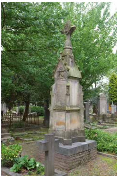
Graf Moonen (1877).

De vijfpaas is tenslotte nog omgeven door drie blinde cirkelvormen binnen de driehoek van het gevelvlak van de dakbekroning. Ook het hart van het topkruis, in vierpasvorm, is verder gedecoreerd met een afbeelding van een kelk en een hostie, symbool voor het Misoffer, opnieuw een verwijzing naar het ambt van de overledene.