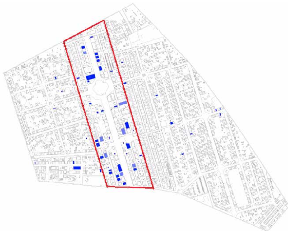
Kaart 2. Neogotische grafmonumenten op de begraafplaats. De rode lijn omsluit het eerste klasse-gedeelte uit 1858.

De neogotische grafmonumenten liggen vooral in dit, toen in gebruik genomen gedeelte met eerste klasse-koopgraven.