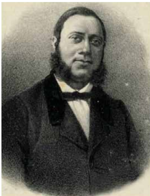
Lithografie van J.A.L.F. (Adolph) Steffens gemaakt door P. Blommers naar een portret door C. Last (1865), Centraal archief Utrecht, catalogusnummer 106538.

De rondboogvelden, de gebruikte bladvormen in de daklijsten, de gestileerde bloem in de nok en vooral het verbreedde dambordpatroon van de daklijsten laten duidelijke laatromaanse invloeden zien. De zuiltjes lijken een vrije interpretatie van de zuilvormen die we ook in de Roermondse Munsterkerk tegenkomen en de daklijsten met het verbreedde dambordpatroon zijn zelfs letterlijk in deze kerk te vinden, onder meer in het interieur in de absidiolen (nevenabsissen) van de gaanderijen, die uitkragen in de transepten.