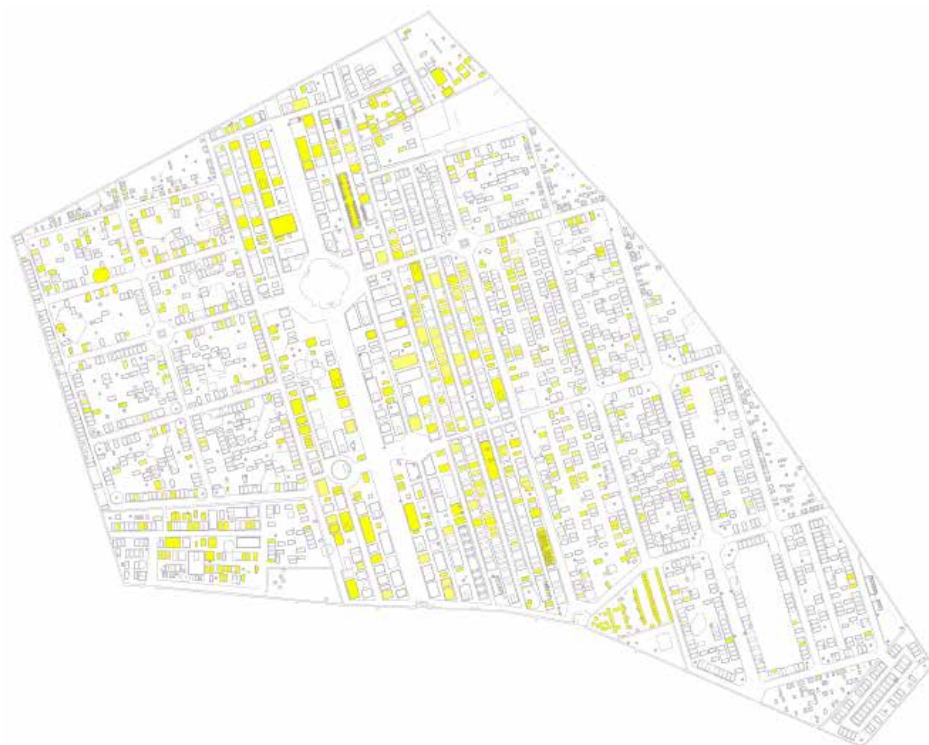
Kaart 1. Neoclassicistische grafmonumenten op de begraafplaats

Andere Stilrichtungen neben der Gotik konnten nur wenig Einfluß gewinnen'. 45