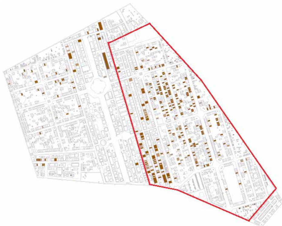
Kaart 3. Art deco-grafmonumenten. Te zien is dat deze grafstijl voorkomt binnen de rode lijn, op de gedeelten van de begraafplaats die vanaf respectievelijk 1883 en 1912 in gebruik waren.

sprekende bewijs van stijlinvloed uit aangrenzende Duitse gebieden. 53 De ‘Nieuwe Zakelijkheid’, een na de Eerste Wereldoorlog sterk opkomende grafstijl, komt in Roermond slechts een enkele keer voor, en dan als mengvorm. Het wijst erop dat stijlvernieuwing op de Roermondse begraafplaats laat kwam en bovendien in zeer geringe mate. In het rustige provinciestedje liep men niet voorop als het om vernieuwingsdrang ging. 54