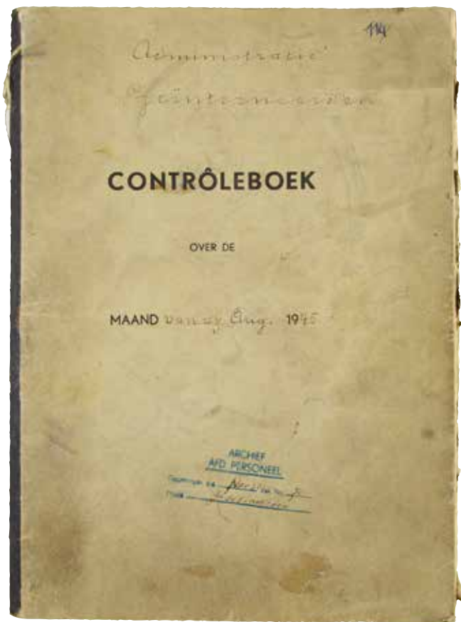
De voorkant van het 'oude schrift', waarin de persoonlijke gegevens van de tewerkgestelde gedetineerden werden genoteerd.

Dat is niet verwonderlijk. Waren er vanaf het najaar 1945 alleen gedetineerden uit het kamp Spekholzerheide aangenomen, in 1946 werd dat anders. Het experiment in de Willem-Sophia was geslaagd. De Mijn Industrie Raad, opvolger van de Ad-VA, besloot tot uitbreiding van het aantal in de mijnen tewerkgestelde politieke delinquenten. Het Directoraat Generaal Bijzondere Rechtspleging (DGBR) werd verantwoordelijk voor de kampen en vroeg op 28 februari 1946 alle kampcommandanten in het land na te gaan wie vrijwillig in de mijn wilde gaan werken. In mei kwam het tot een overeenkomst en vanaf juni 1946 ging een grotere stroom gedetineerden vrijwillig naar de kolenmijnen. 10