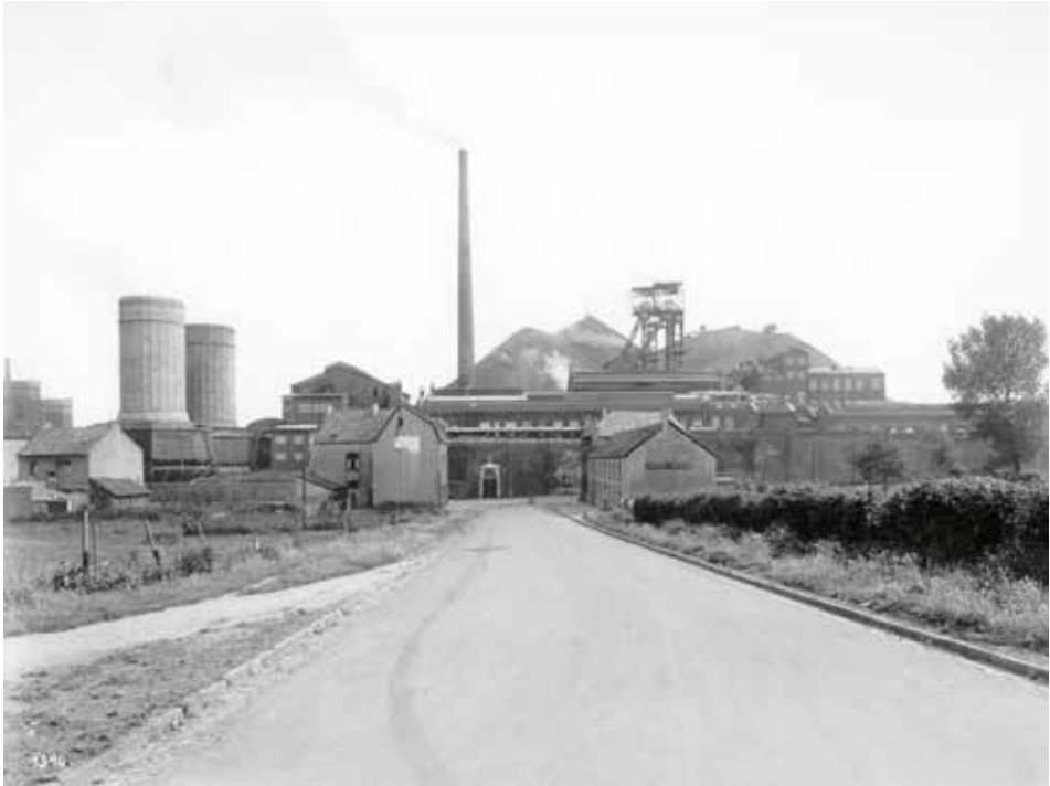
Toegangsweg tot de mijn Willem-Sophia in Spekholzerheide, 1940.

De man met de langste werkduur was een paar jaar lid geweest van NAF, WA en NSB. Sommigen waren waarschijnlijk alleen maar lid geweest. Want anders is niet te verklaren dat drie personen met toestemming van de CvB al in maart 1946 weer in dienst mochten treden van de mijn, en één in mei 1946. Enkele voorbeelden volgen hierna. Van de overige vier is herintreding niet bekend, omdat hun ontslag uit het kamp buiten de onderzoeksperiode valt.