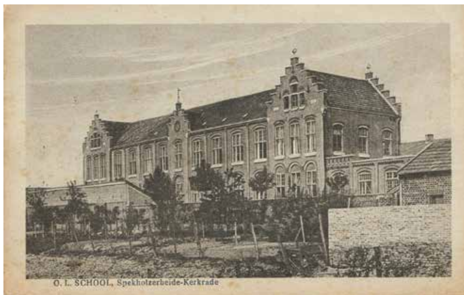
'Kamp Spekholzerheide': de leegstaande openbare lagere school in Spekholzerheide deed dienst als onderkomen voor de politieke delinquenten die vanaf augustus 1945 in de Willem-Sophia tewerkgesteld werden.

ling geformaliseerd en konden ook gedetineerde niet-mijnwerkers op vrijwillige basis gaan werken in de mijnen. 2