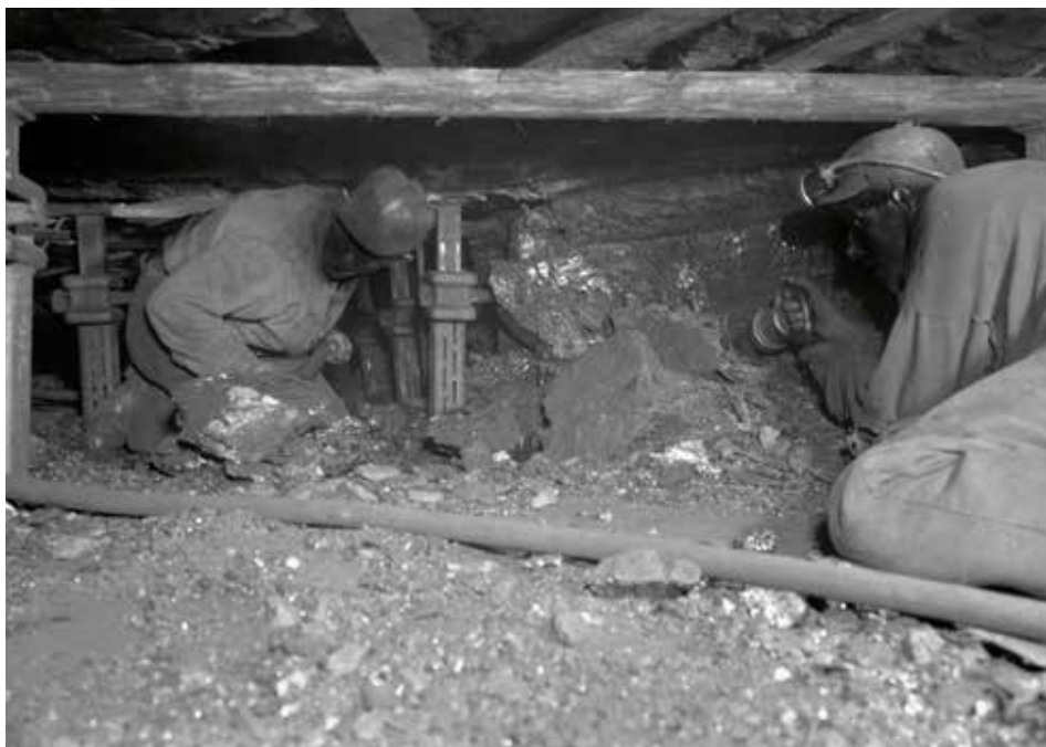
Een houwer en hulphouwer aan het werk in één van de pijlers van de Willem-Sophia, 1948.

De leeftijden van hen die op 27 augustus 1945 begonnen, liepen uiteen van 18 tot en met 54 jaar. De meesten waren jong. Hoewel 16- of 17-jarigen ontbraken, was toch 65 procent tussen de 18 en 35 jaar, van wie 54 procent zelfs 25 jaar of jonger. Als we kijken naar de latere periodes van aanstelling, dan lopen de percentages niet wezenlijk uiteen. Alleen is opvallend dat het percentage 18- tot 25-jarigen eerst daalt van 32 naar 24 procent, maar dat dit percentage tussen februari en juni 1946 stijgt naar 48 procent. Met andere woorden: bijna de helft van de in 1946 aangestelden is 25 jaar of jonger. Kwam dat door de toeloop van delinquenten na april 1946? In de overeenkomst die op 1 juni 1946 van kracht werd, was geen bepaling opgenomen over leeftijdscriteria. 19