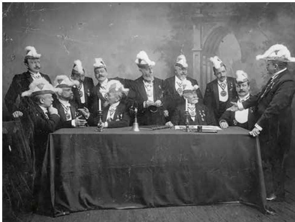
Groepsportret van het bestuur van Sociëteit Momus, gemaakt in 1909.

len. Een verlicht protestantisme werd hierbij in Nederland als vanzelfsprekend verondersteld. Fanatisme was uit den boze, want niet rationeel. 2