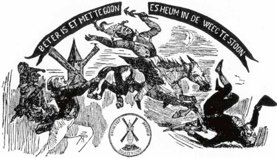
Titelvignet van Momus Annalen uit de beginjaren van de vereniging, met het ietwat omineuze motto. Uit: 9 x 11 (+ 11/11) Momus-Jubilee 1839-1938 (Maastricht 1938).

deur heubbe komme luusterre'. 62 Het verzet was niet alleen politiek gemotiveerd, maar ook economisch. De opkomende groepen in Maastricht ergerden zich aan de stedelijke autoriteit, die ouderwets van mening bleef dat de hoekstenen van het economisch leven werden gevormd door dienstverlening voor het garnizoen en handel. 63 Het kritische Momus bleef in de eerste jaren bij verschillende gelegenheden tegenwerking ondervinden van het stadsbestuur. 64