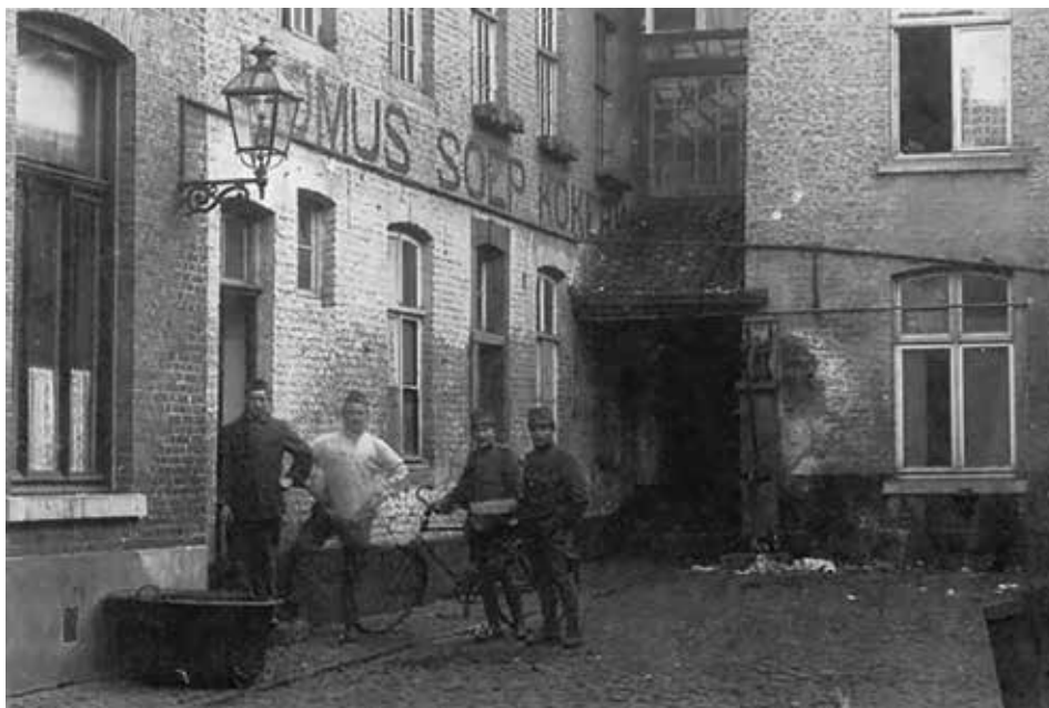
De 'Momus Soepkokerij' in het Heilige Geeststraatje bij de Markt, 1914. De soepkokerij was in bedrijf van 1846 tot 1919, toen de Gemeente Maastricht die taak overnam.