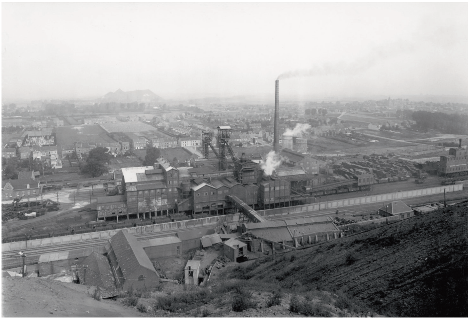
Gezicht op de Willem-Sophia vanaf de top van de naastgelegen steenberg in 1941. Gemeten naar productie en personeelsomvang was deze particuliere mijnonderneming de kleinste van alle Nederlandse steenkolenmijnen. De Willem-Sophia was in Waalse handen; de productie begon er in 1902.

de regering? Ook in België werden geïnterneerde collaborateurs, of ‘incivieken’ zoals ze in België werden genoemd, in de steenkolenmijnen aan het werk gezet. Is de Nederlandse besluitvorming daardoor beïnvloed? In de loop der jaren zijn er nogal wat publicaties verschenen waarin het al dan niet gedwongen werken van politieke delinquenten in de mijnen aan de orde komt. 2 Maar antwoord op de vraag hoe het allemaal begon is hierin niet te vinden. In dit artikel belicht ik de tewerkstelling in de steenkolenmijn Willem-Sophia te Spekholzerheide, de eerste Nederlandse mijn die politieke delinquenten in dienst nam. 3 Na een schets van de problemen met