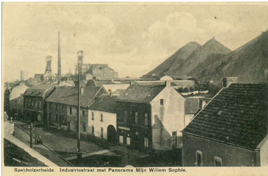
Speckholzerheide. Industriestraat met Panorama Mijn Willem Sophie.

Gezicht op Speckholzerheide vanaf het dak van een van de huizen aan de Industriestraat, met rechts de schachtorens en gebouwen van de Willem-Sophiamijn. Jaartal onbekend. Collectie SHCL.