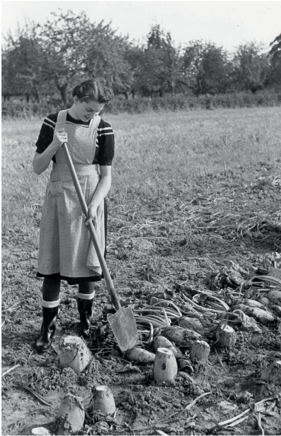
Een boerendochter tijdens het bietensteken omstreeks 1955.

De in belang toenemende tuinbouw heeft dit terugdringen van de vrouw uit het productieproces versterkt. Voor de arbeid van meewerkende gezinsleden was echter van groot belang dat deze tak van landbouw in bepaalde seizoenen voor plukarbeid aanspraak bleef maken op de inzet van vrouwelijke arbeidskracht. Wanneer er dochters op het bedrijf beschikbaar waren, werden deze ingezet; was dat niet het geval dan nam men loonarbeid(st)ers in dienst, wellicht ook vrouwen uit de gezinnen van de mannelijke loonarbeiders. Voor tuinderijen elders in het land werd geconstateerd '[...] dat de meisjes bij voorkeur werk zoeken in een gezin, dat zooveel mogelijk aan haar eigen milieu beantwoordt (landarbeidersdochters bij boeren, burgerdochters bij middenstanders, enz.)'. 30