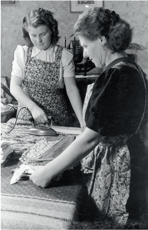
Oudere meisjes in Limburgse mijnwerkersgezinnen werden geacht mee te helpen in de eigen huishouding, of werden 'uitbested' aan familie of kennissen.

Volgens overlevering zou 'uitbesteding' in Limburg een vrij algemeen verschijnsel zijn geweest, met name in de mijnwerkersgezinnen. 2 Voor een ongehuwde vrouw uit een mijnwerkersgezin betekende dit veelal het meehelpen in een winkel of in een andere huishouding. Meisjes werkten soms op drie tot vier verschillende adressen, zonder daarvoor een vast loon te krijgen. Voor de meisjes zelf leverde deze arbeid nauwelijks iets op, maar als vorm van wederzijdse dienstverlening was die voor de gezinseconomie wel degelijk van belang. Mondelinge getuigenissen kunnen hier een tipje van de sluier oplichten. Zo wilde mijn moeder als jonge vrouw in een mijnwerkersgezin graag naaister worden in het atelier van een mode-