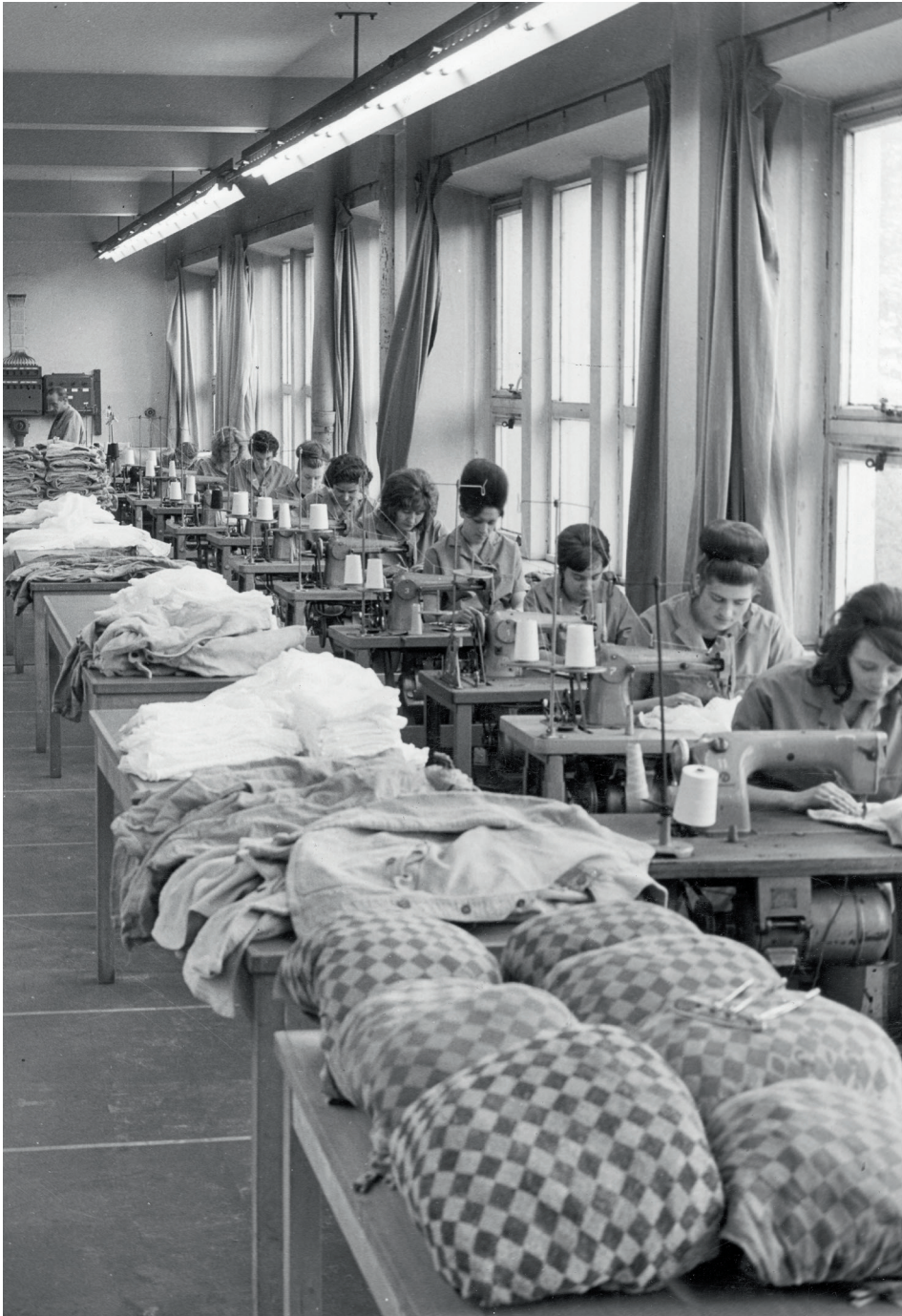
De verstelafdeling van de pungelwasserij van Staatsmijn Maurits, 1957. Het was een van de weinige plekken op dit enorme mijncomplex waar meisjes uit Stein employo vonden.