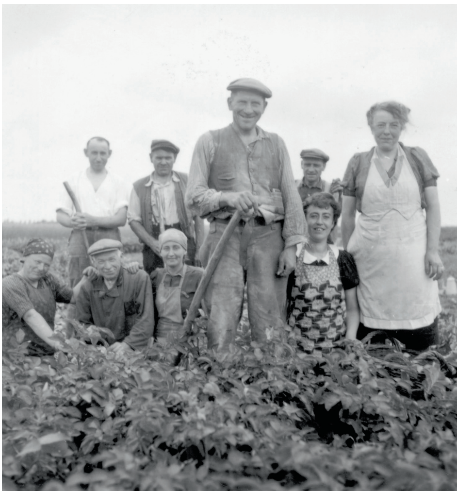
Een Noord-Limburgse boerenfamilie poseert tijdens het werk voor de camera, omstreeks 1950.

arbeidsschaarste, werd gewezen op de ‘zeer hoge loonen van boerendienstboden, die het werk van een boerenknecht willen aanvaarden’. In kleine bedrijven viel dit werk toe aan de dochters: ‘Op de dochters van de kleine boeren rust een zware taak. [...] De meisjes moeten [...] in vele gevallen het werk van een boerenknecht verrichten’. 23 Aangezien in Horst het kleine gezinsbedrijf overheerste, zal dit in veel gezinnen zijn voorgekomen.