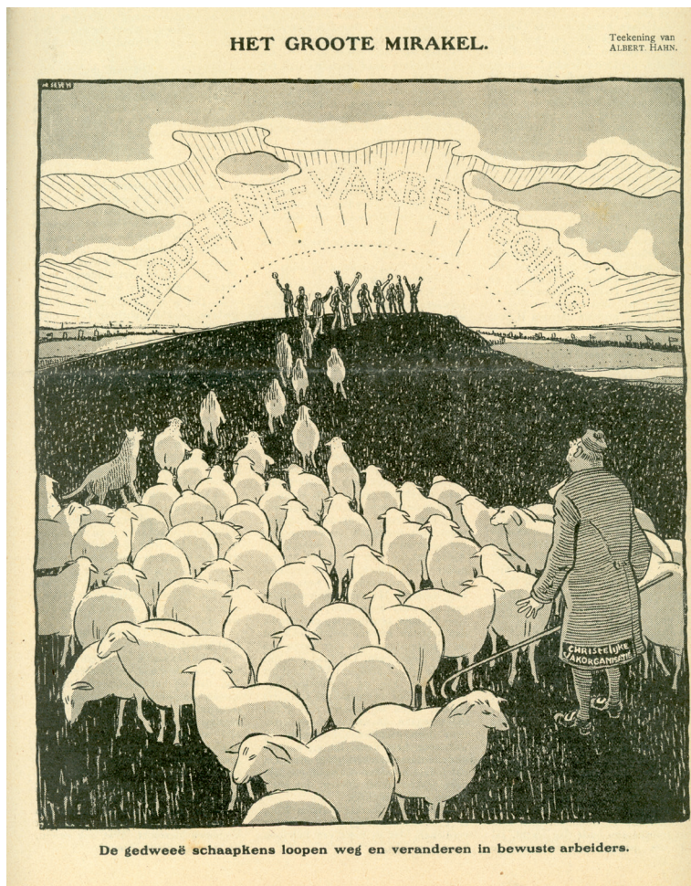
Spotprent van Albert Hahn, verschenen in De Notenkraker van 24 april 1924.

lokale autoriteiten over de grens gezet. 51 In 1911 werd een Rechtsauskunftsstelle opgericht in Kerkrade, om bijstand te verlenen aan ‘unsere deutsche Kameraden und jene holländische Kameraden die früher in Deutschland gearbeitet haben und sich dort Ansprüche an die Knappschaftskassen und Unfallversicherung erworben [haben]’. 52 Een duidelijk teken van de Duitse aanwezigheid onder de leden is het excuus van een vrouwelijke spreker uit Zaandam op een feestelijke bijeenkomst