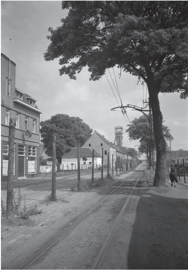
De Kerkradse en Akense arbeidsmarkten waren verregaand geïntegreerd, hier geïllustreerd door de ligging van de Domaniale Mijn pal aan de grens in Kerkrade, 1948. De prikkeldraadversperring, die de grens tussen Nederland (links) en Duitsland (rechts) markeert, dateert nog van de Tweede Wereldoorlog.

werd sterker door de terugkeer van Nederlandse mijnwerkers uit Duitsland die actief waren geweest in de Christliche Gewerksverein, maar het land waren uitgezet na de grote Duitse mijnwerkersstaking in 1905. 20 Zij voerden een campagne om ook in Limburg werkende Nederlandse mijnwerkers interconfessioneel te organiseren en begonnen daartoe in Limburg afdelingen van de Duitse bond op te richten. 21