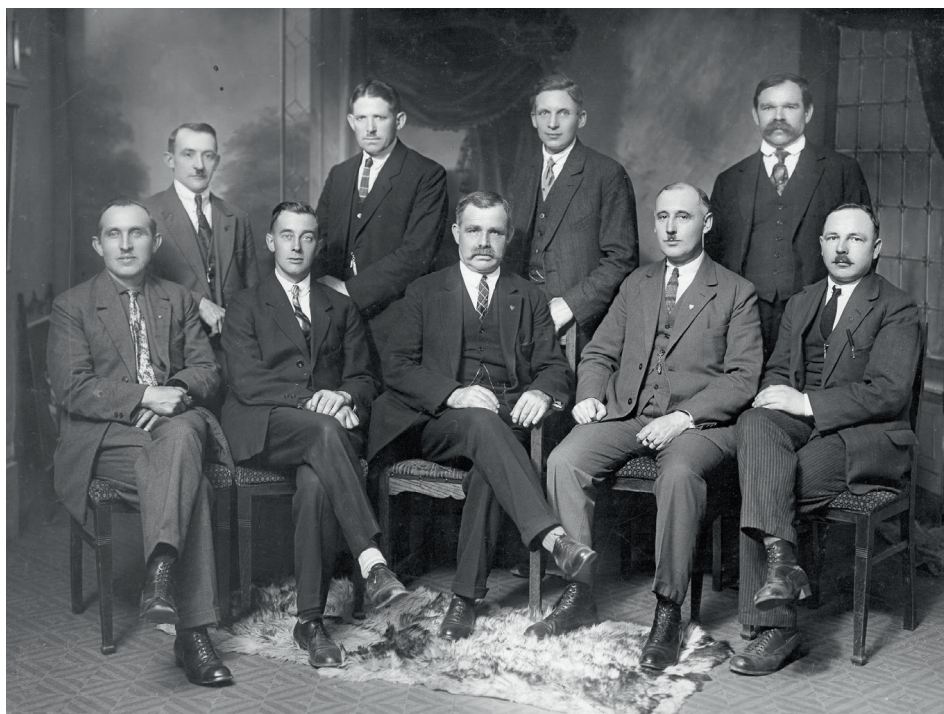
Groepsportret van het bestuur van de Algemene Nederlandse Mijnwerkers Bond omstreeks 1920.

van het ledental van 11 naar 106. Vanwege de groei van de mijnwerkersbevolking in de mijnstreek rondom Heerlen werd dit als een doorbraak beschouwd: 'Wat Kerkrade is voor de oudere afdelingen zijn Hoensbroek, Lutterade en in de naaste toekomst Brunssum voor de nieuwe afdelingen. Vanuit Hoensbroek kunnen de omliggende kleinere gemeenten ook gemakkelijk worden bewerkt'. 89 Ook de ANMB berichtte over ledengroei in Hoensbroek in 1915 van 60 tot 200. 90