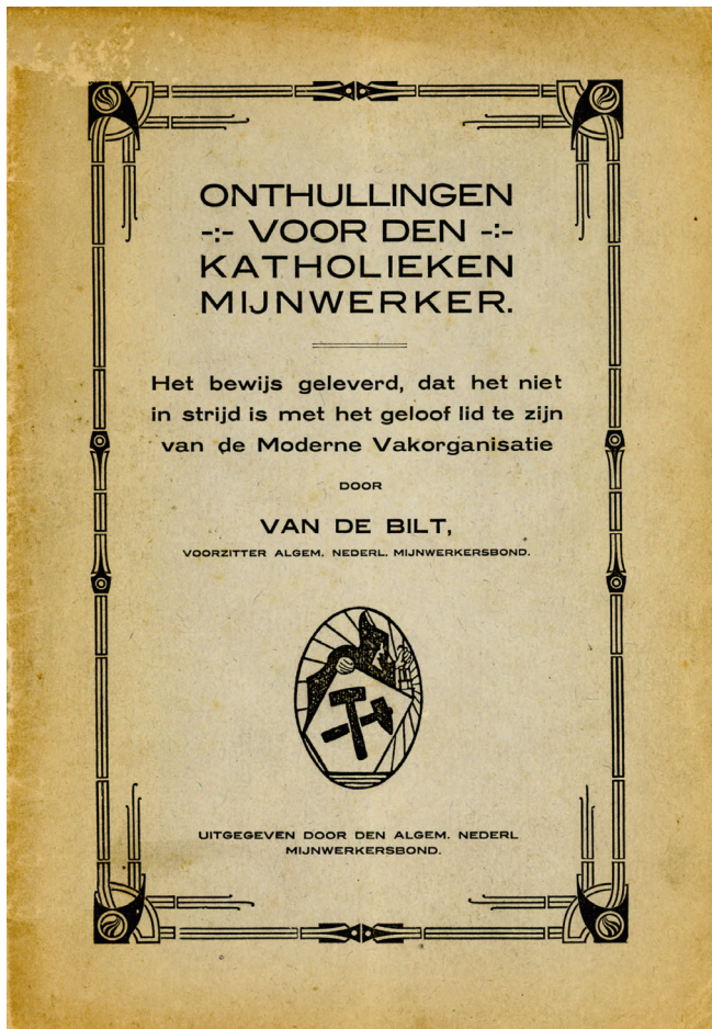
Voorblad van een brochure van de ANMB uit 1923, die erop was gericht katholieke mijnwerkers over te halen lid te worden van deze neutrale, niet-katholieke vakbond.

valutaverhoudingen in 1923 verlaten, maar de socialistische bond haalde een nog grotere overwinning met 31 zetels. Deze verkiezingswinst was opnieuw voorafgegaan door electoraal succes in arbeiderscommissies op verschillende mijnen. Voor de ANMB was dit een teken dat meer en meer autochtone Limburgse mijnwerkers de socialistische kant hadden gekozen, 148 en dat 'een gedeelte der Limburgers die de vorige maal nog op de lijst der Christelijken hebben gestemd,