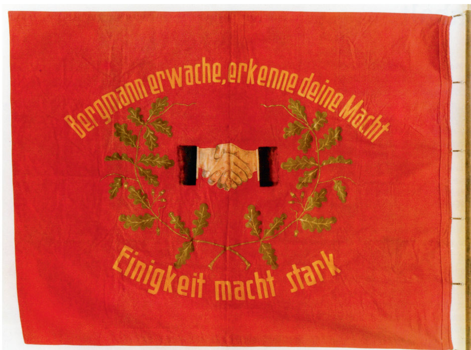
Duits vakbondsvaandel, waarschijnlijk van het 'Alte Verband'.

(ANMB) worden opgericht, met steun van zowel het Alte Verband als het Nederlandsch Verbond van Vakverenigingen (NVV). Net als in het Akense gebied was de inheemse bevolking in het Limburgse mijndistrict voor het overgrote deel katholiek. Tot in de jaren 1920 was er echter een hevige competitie tussen beide bonden om de steun van de Limburgse mijnwerkers. Pas in de jaren 1930 slaagde de katholieke opvolger van de interconfessionele CMB, de Nederlandsche Katholieke Mijnwerkers Bond (NKMB, vanaf 1926), er definitief in de ANMB te overvleugelen.