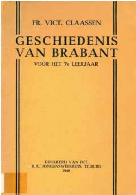
De voorkant van het in 1940 verschenen schoolboek 'Geschiedenis van Brabant' van de hand van frater Victorianus Claassen.

voor vaderlandse en algemene geschiedenis. 25 Pas vanaf de laatste eeuwwisseling verschenen geactualiseerde versies, vaak in reactie op het uitkomen van de nationale canon van de Nederlandse geschiedenis voor het onderwijs in 2004 en in aansluiting op de ontwikkeling van provinciale en lokale canons. 26