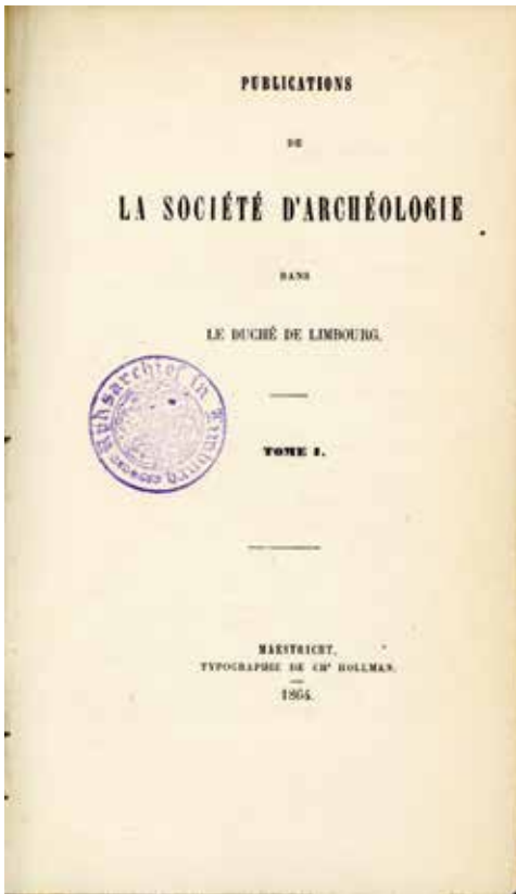
Titelpagina van de eerste jaargang van het jaarboek van het Oudheidkundig Genootschap in het hertogdom Limburg uit 1864.

een wel aardig niveau, maar professioneel was het vrijwel nergens tot omstreeks 1900. Historici die zich op de universiteit de methode van de systematische bronnenkritiek hadden eigen gemaakt, zouden in de provincie pas na de eeuwwisseling hun intrede doen.